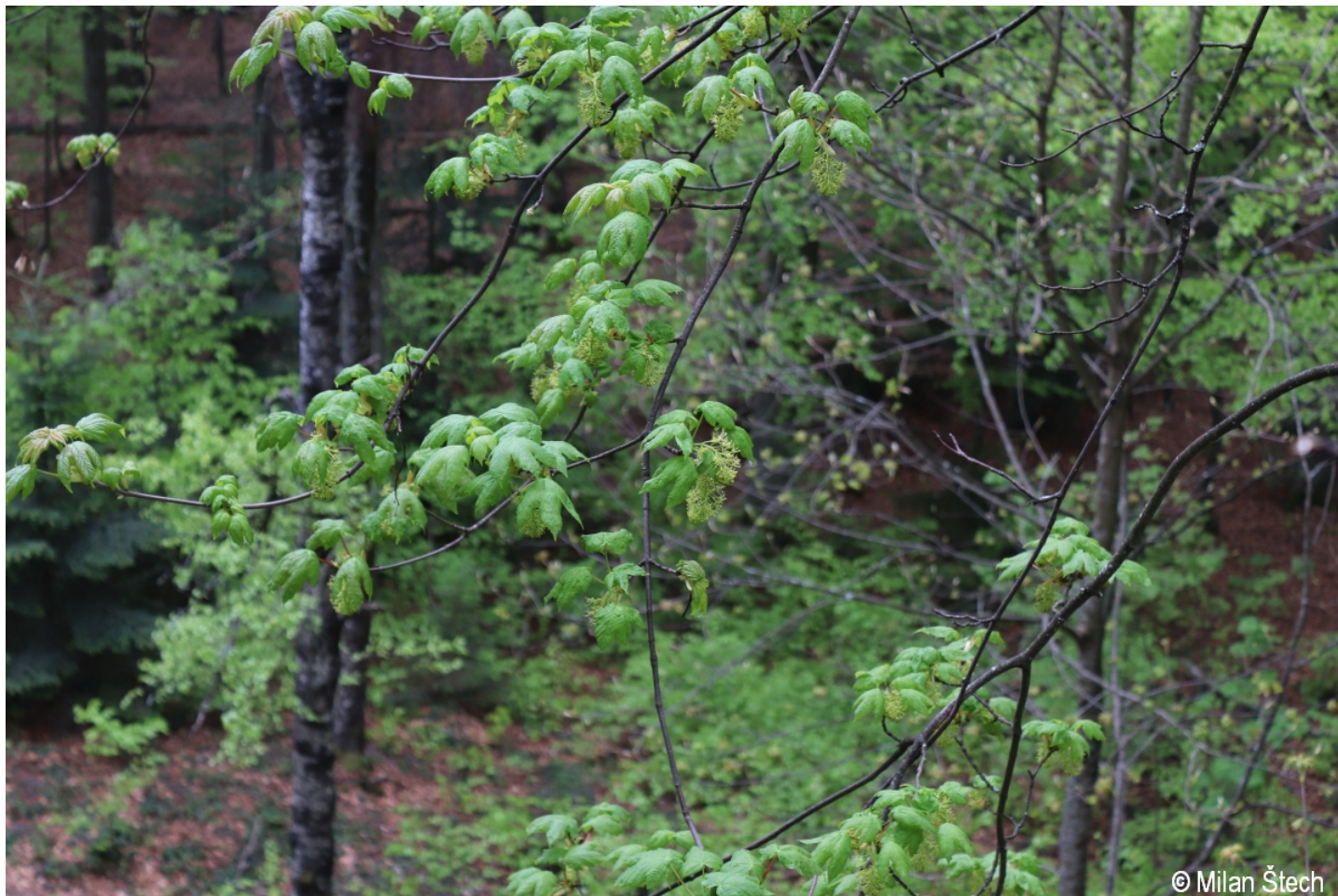
Acer pseudoplatanus – Milan Štech – Neuschönau.