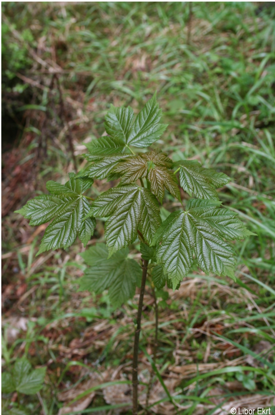
Acer pseudoplatanus – Libor Ekrť – Vydra.