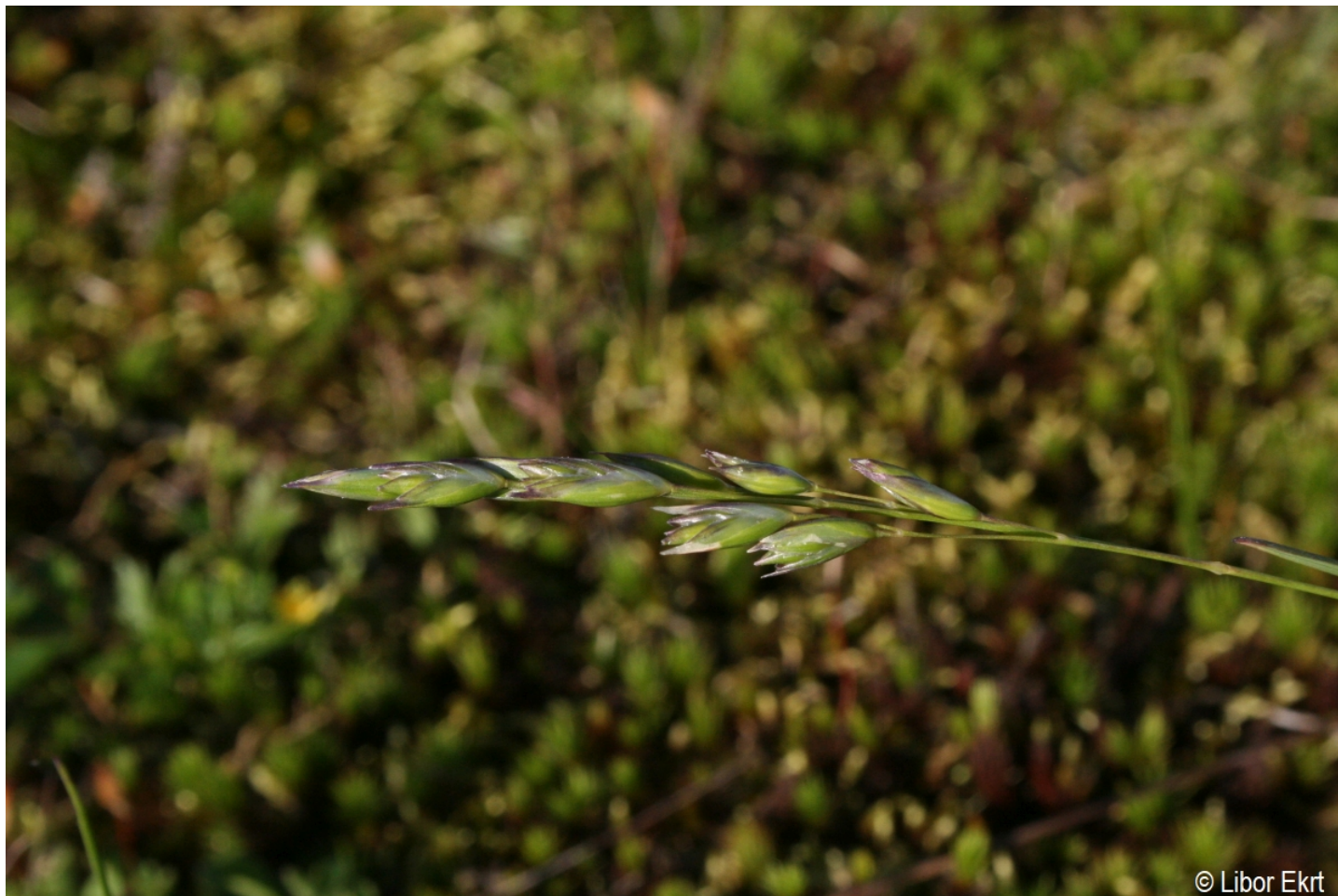
Danthonia decumbens – Libor Ekrť – Kepelské Zhůří.