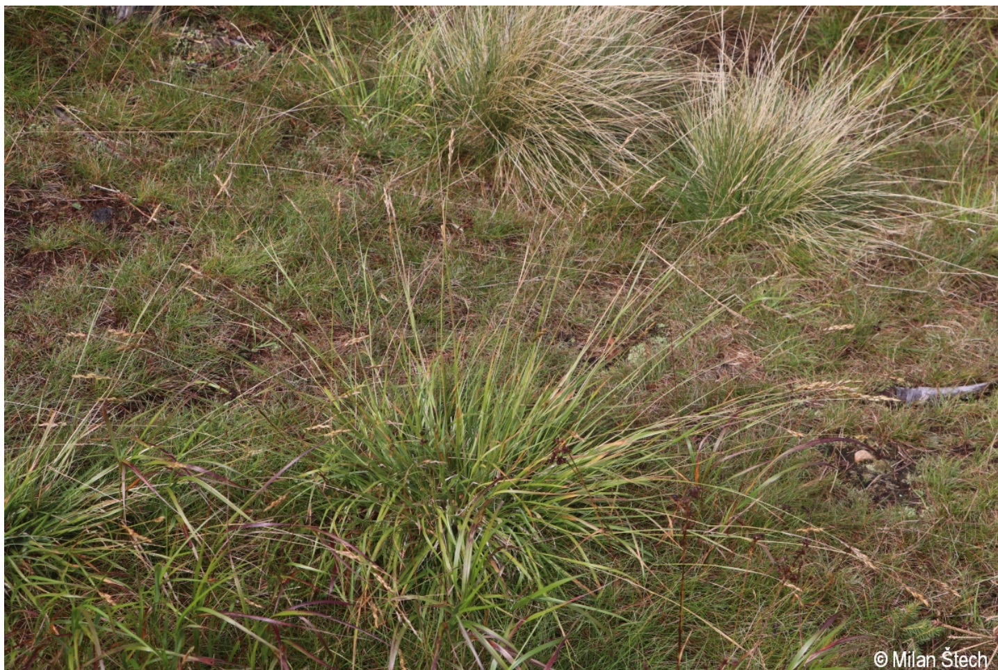
Danthonia decumbens – Milan Štech – Lakaberg.