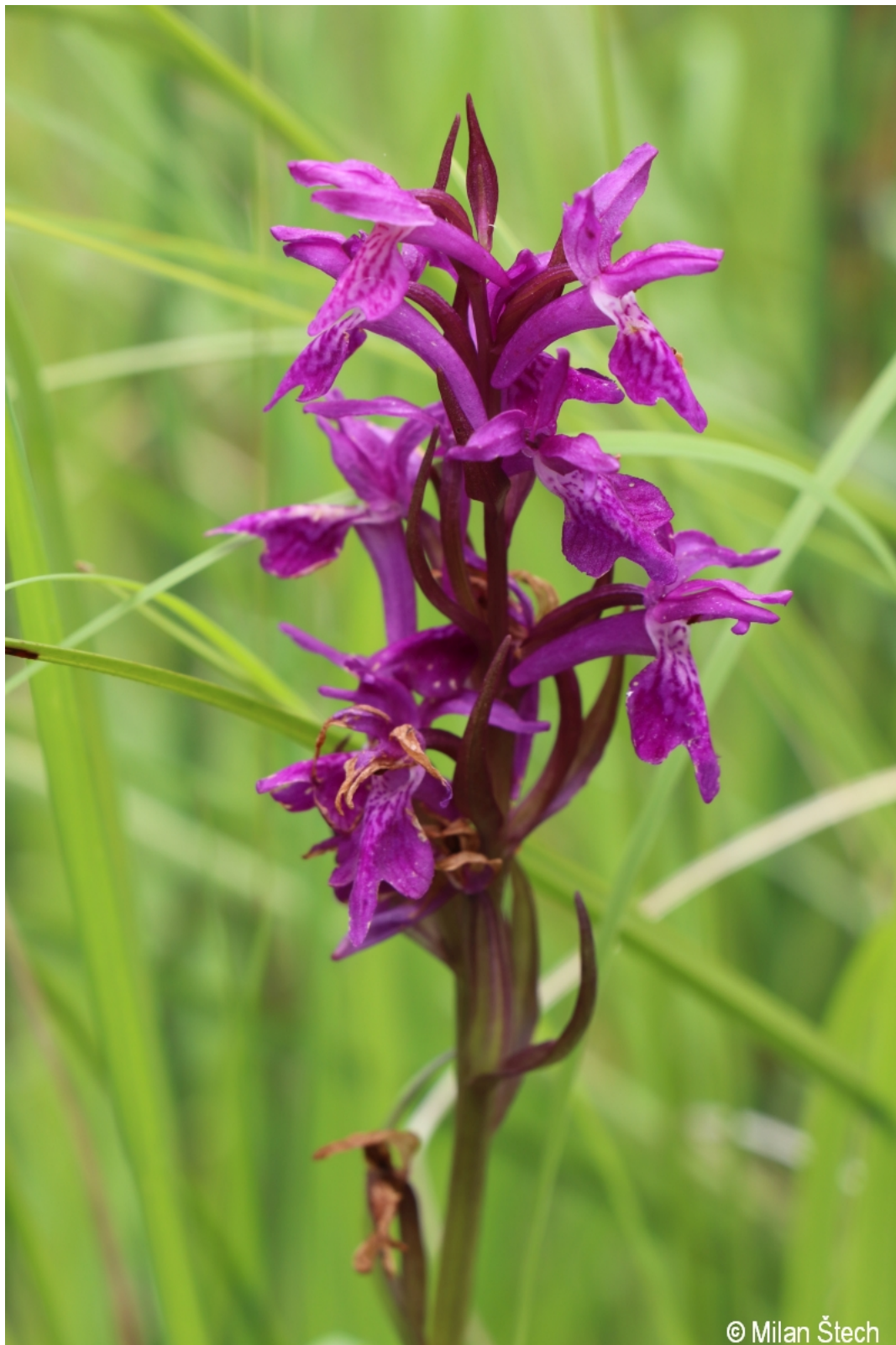
Dactylorhiza traunsteineri subsp. traunsteineri – Milan Štech – Klosterfilz.