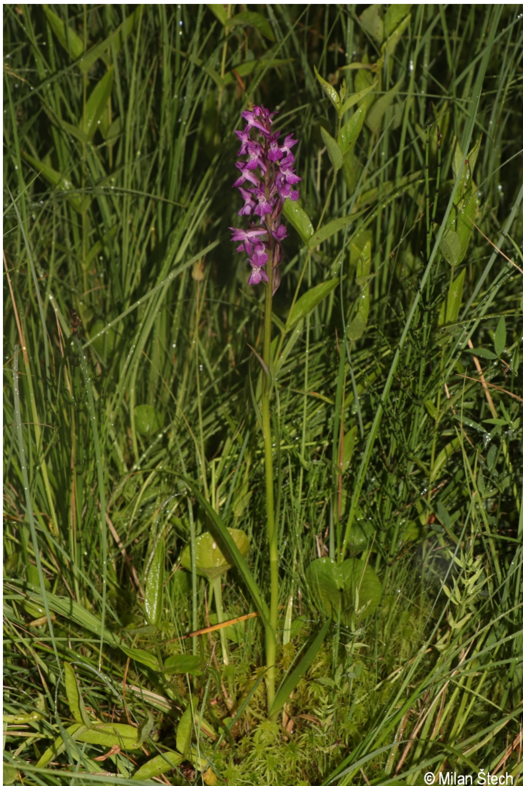
Dactylorhiza traunsteineri subsp. traunsteineri – Milan Štech – Želnavá.