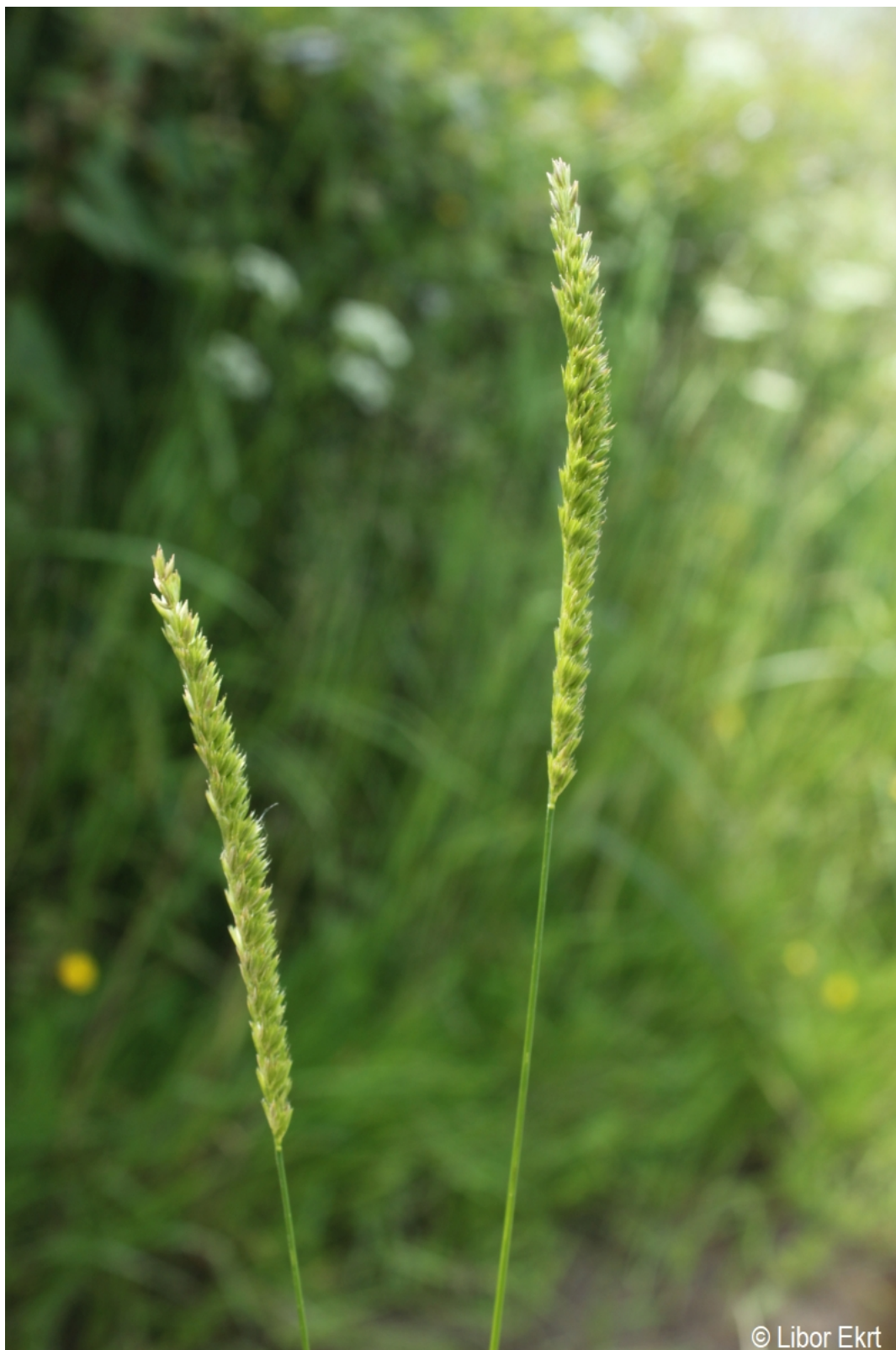
Cynosurus cristatus – Libor Ekrť – Pestřický vrch.