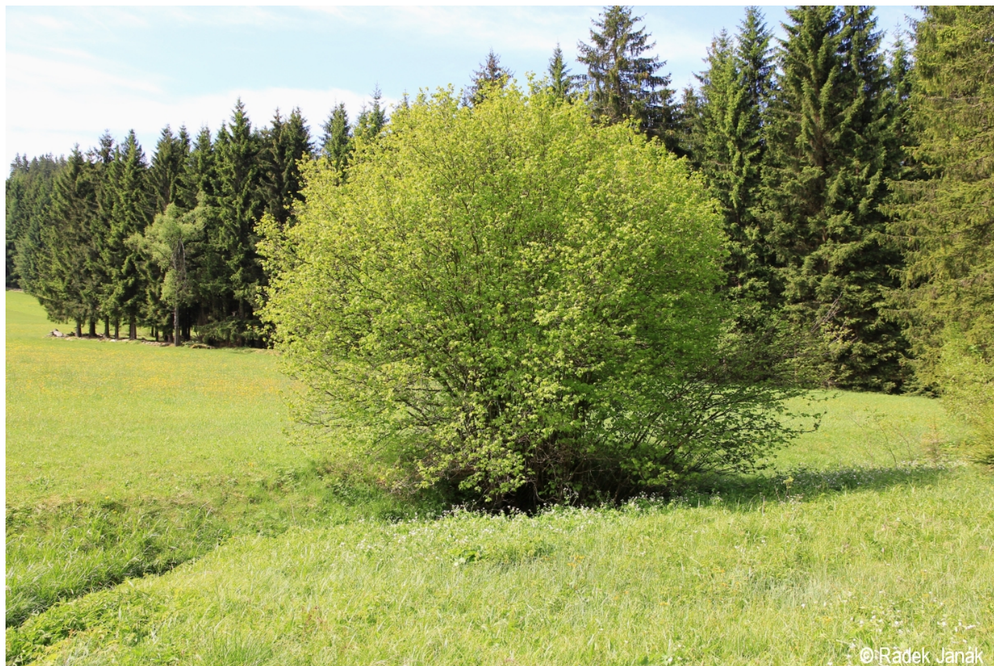
Corylus avellana – Rádek Janák – Vyšebrodsko.