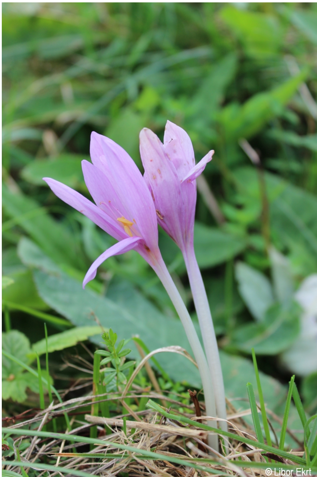
Colchicum autumnale – Libor Ekrt – Klášterec.