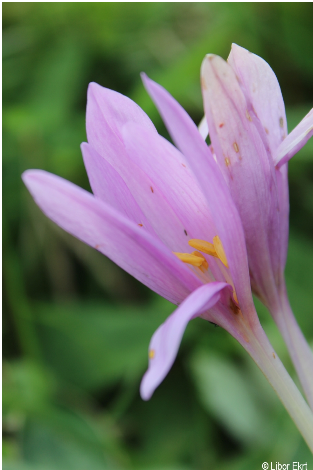
Colchicum autumnale – Libor Ekrt – Klášterec.