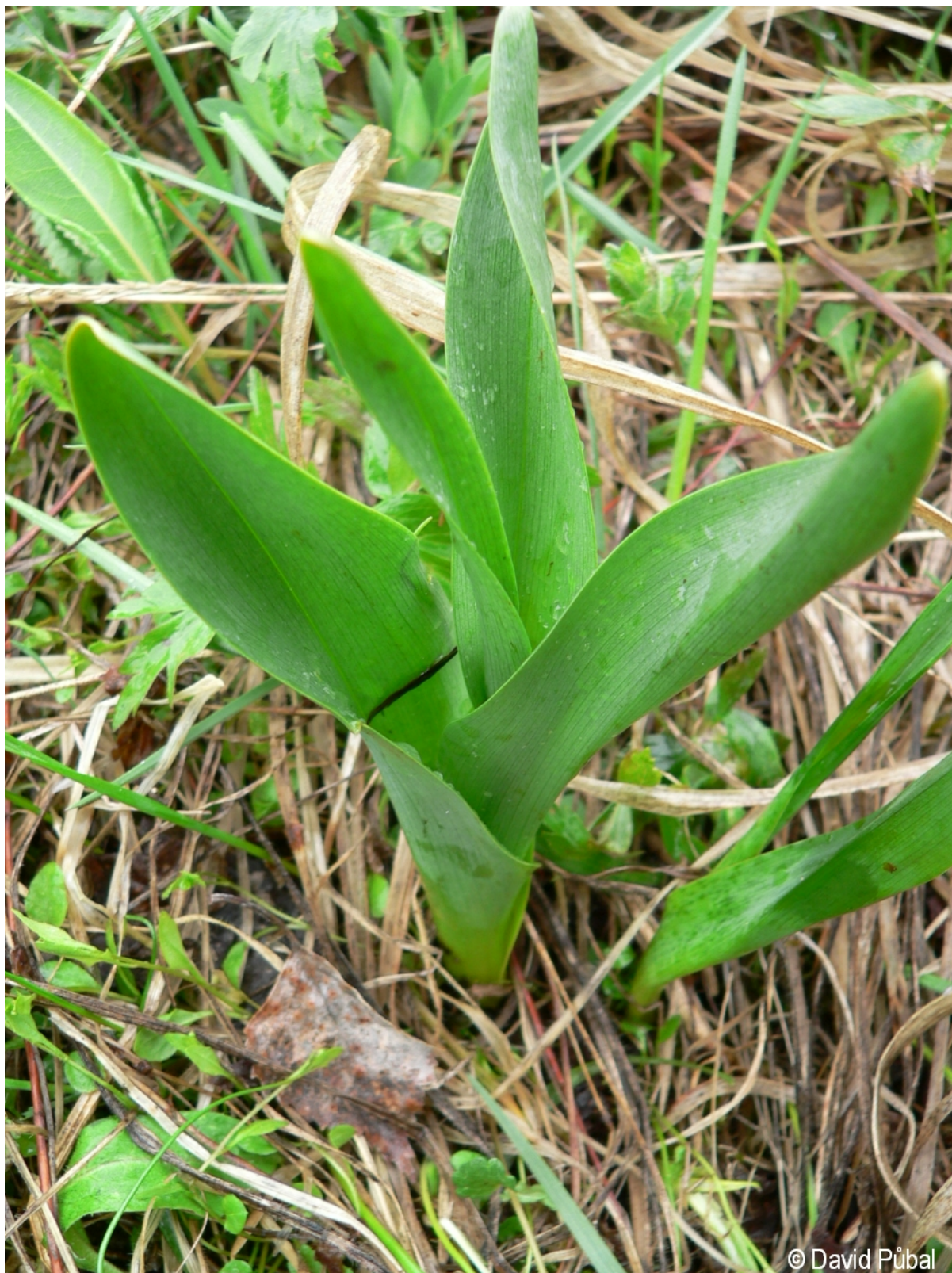
Colchicum autumnale – David Půbal – Radost.