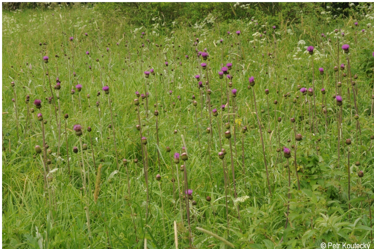
Cirsium heterophyllum – Petr Koutecký – Nová Pec.