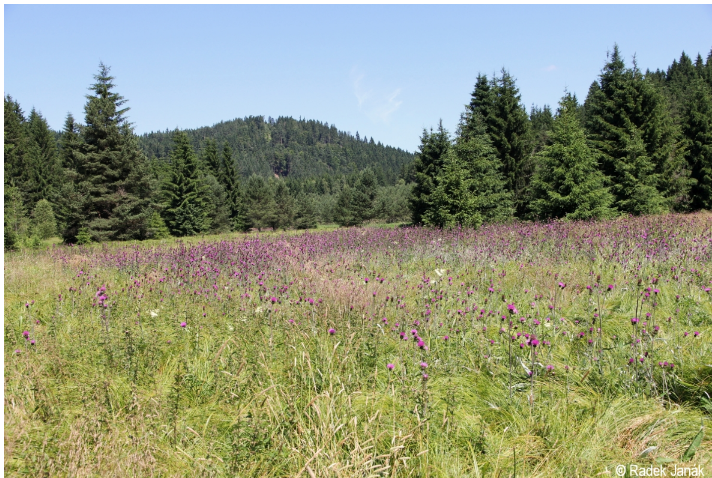
Cirsium heterophyllum – Radek Janák – Vyšebrodsko.