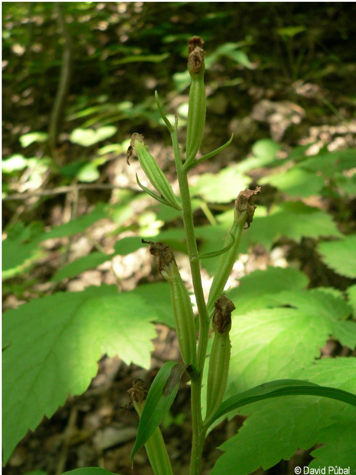
Cephalanthera damasonium – David Půbal – Černá v Pošumaví, Vápenný vrch.