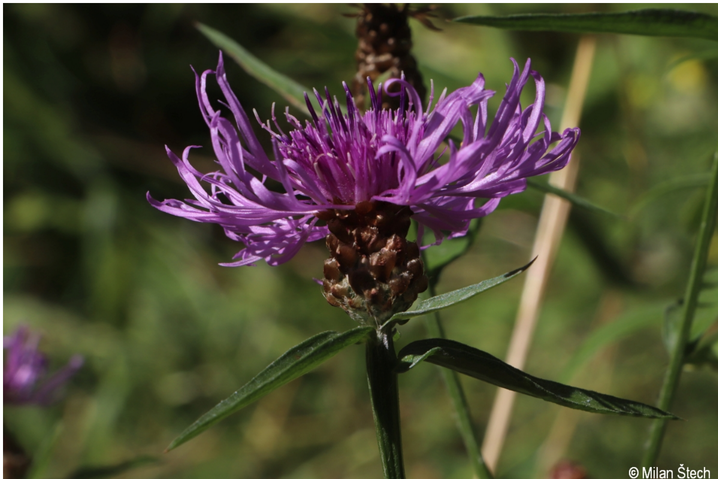
Centaurea jacea – Milan Štech – Olšina.