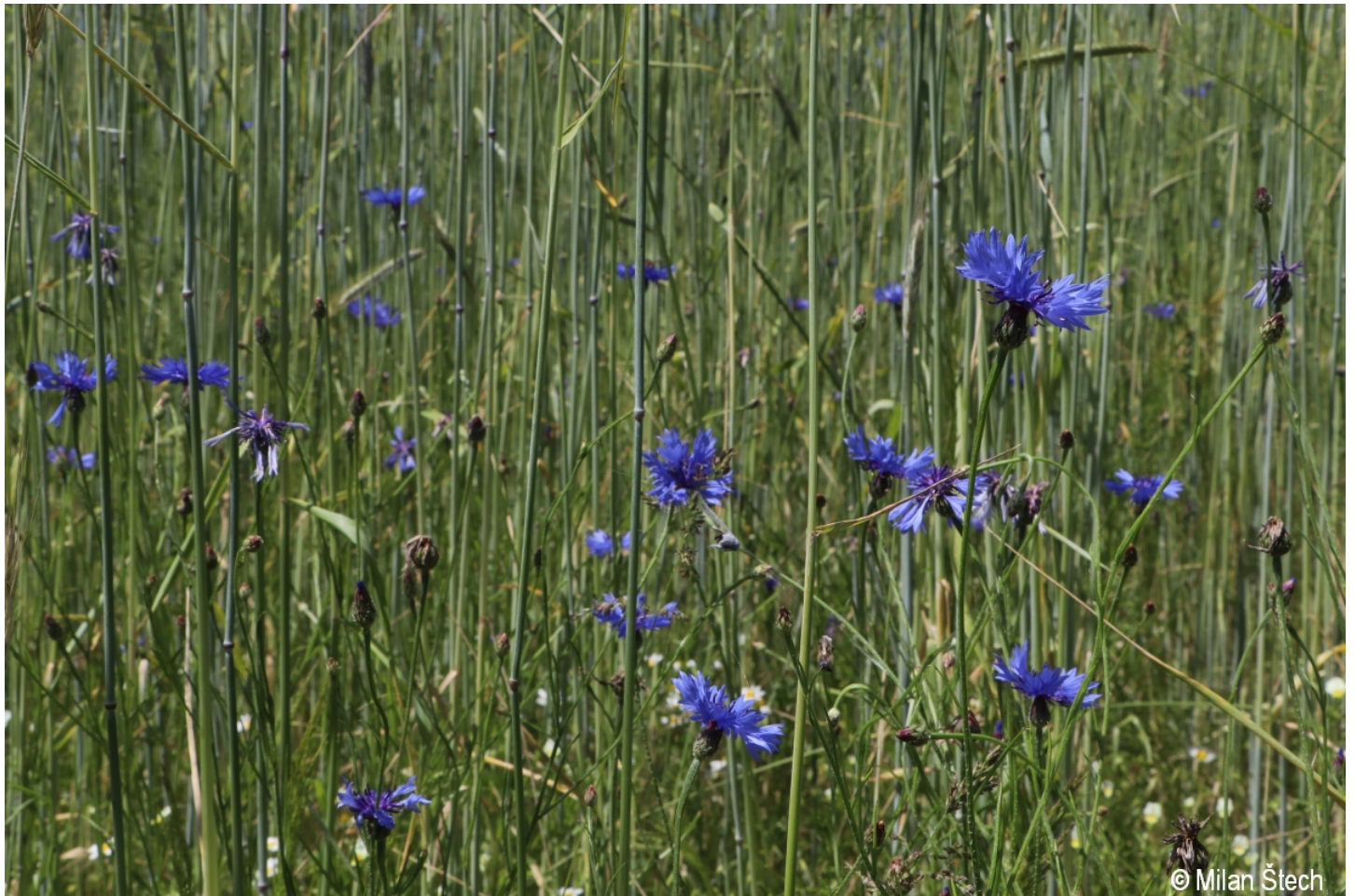
Centaurea cyanus – Milan Štech – Guglwald.