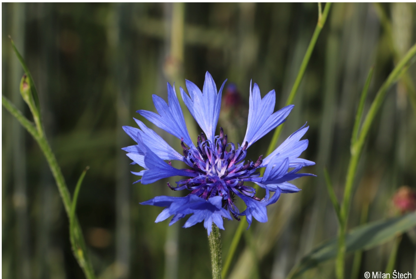
Centaurea cyanus – Milan Štech – Rožnov.