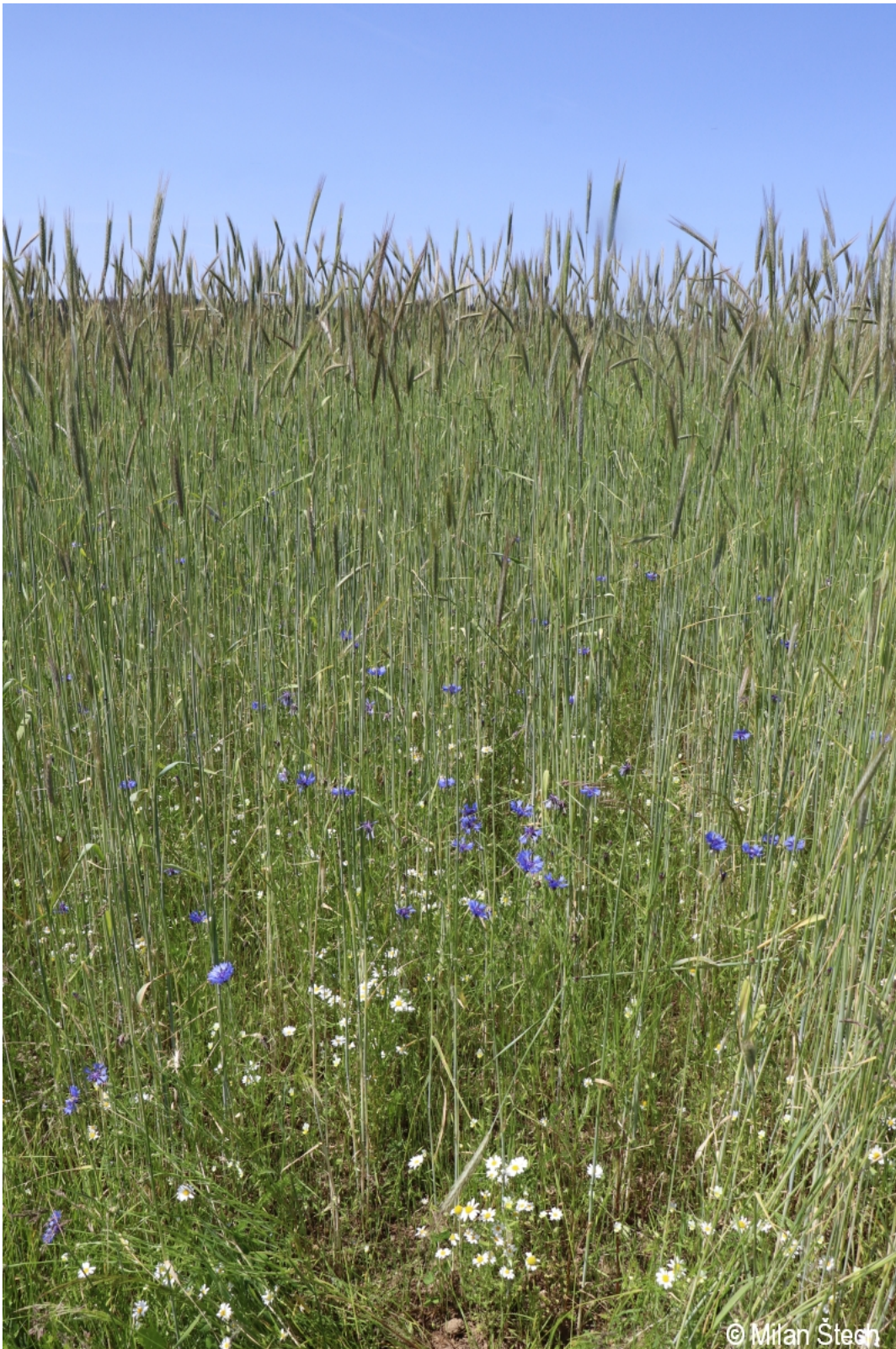
Centaurea cyanus – Milan Štech – Guglwald.