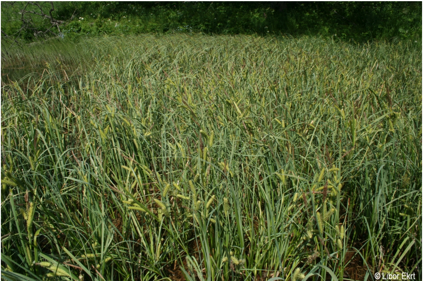
Carex rostrata – Libor Ekrť – Chaloupky.