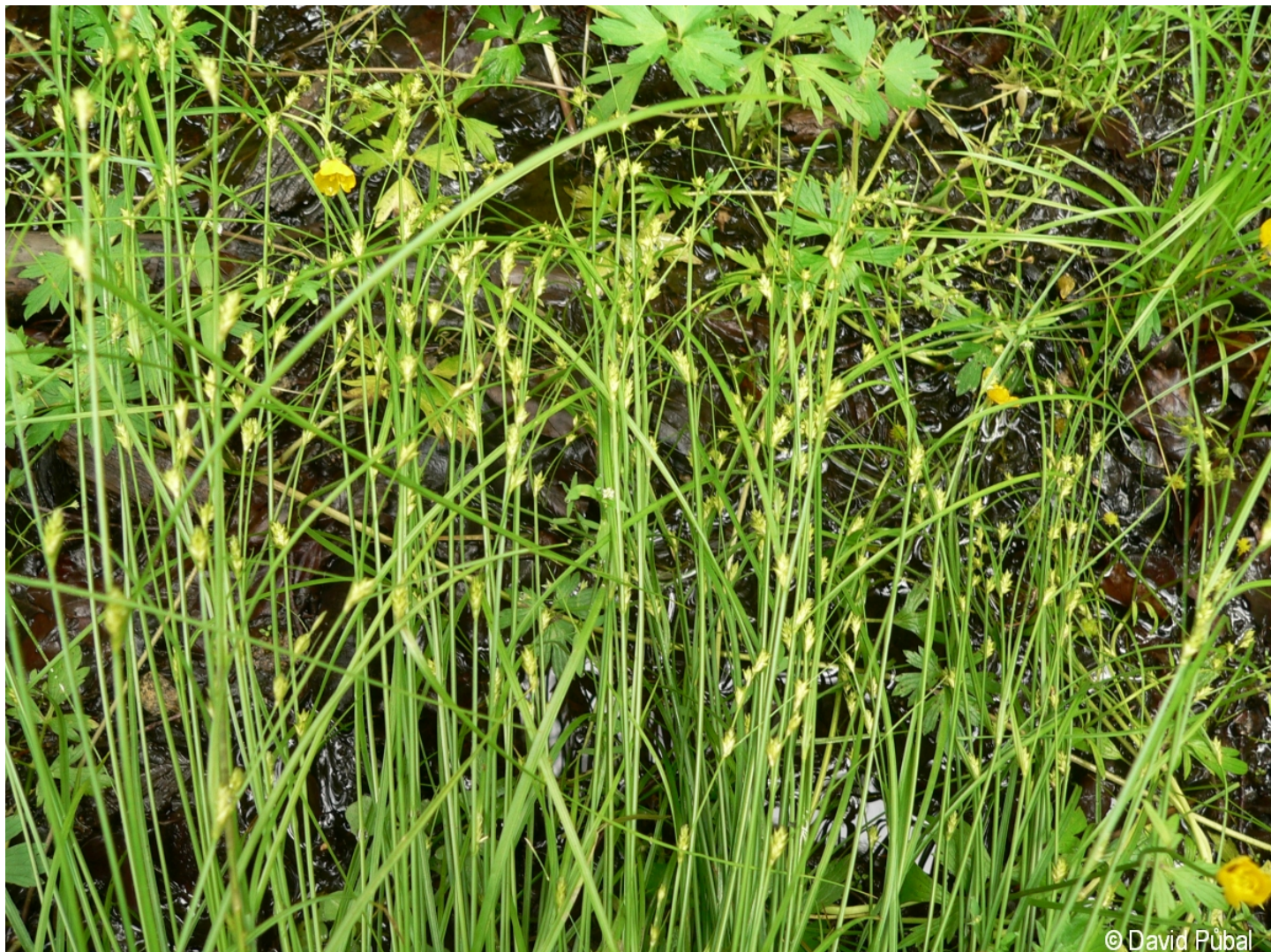
Carex remota – David Půbal – Boubín.