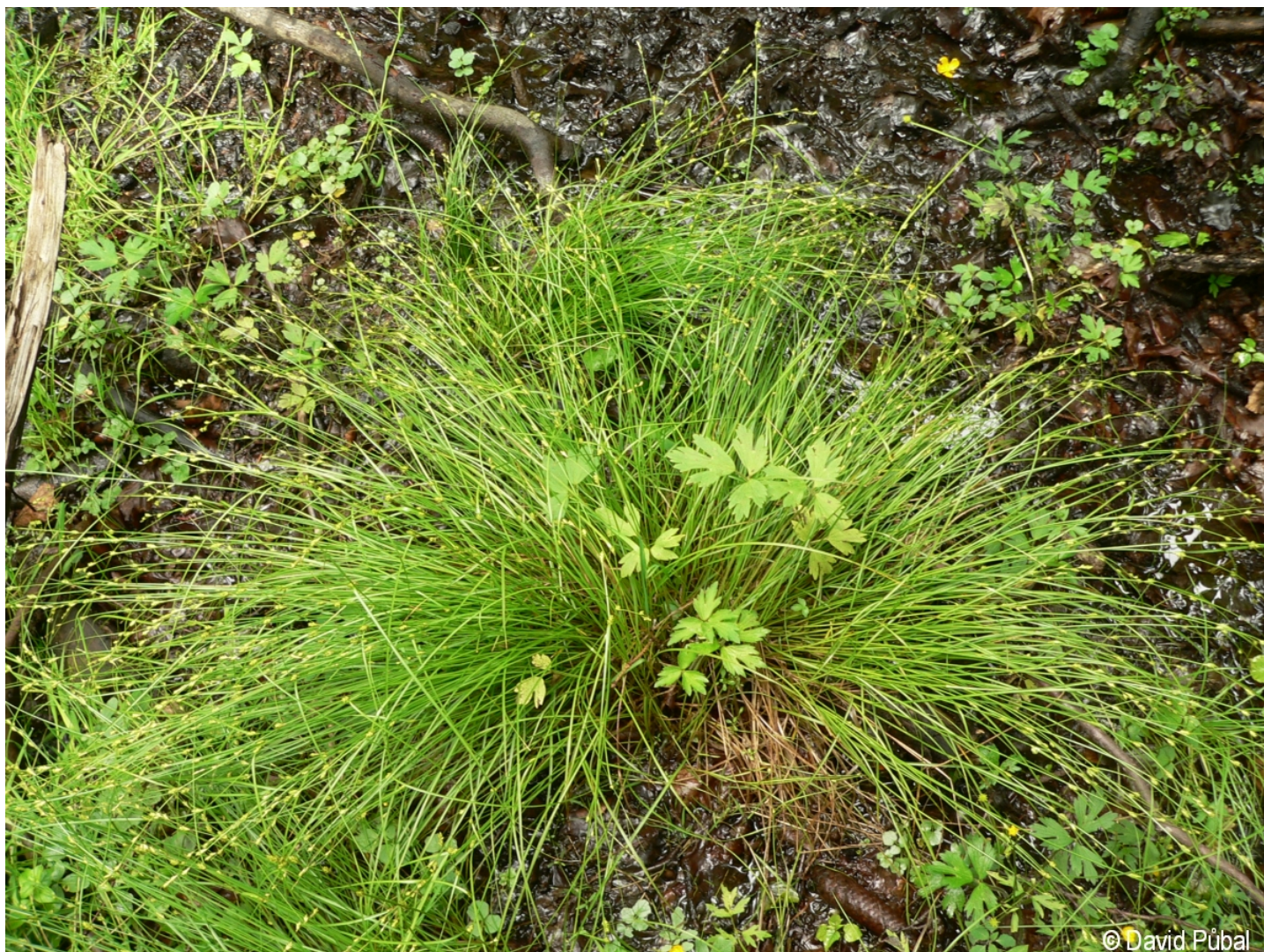
Carex remota – David Půbal – Boubín.