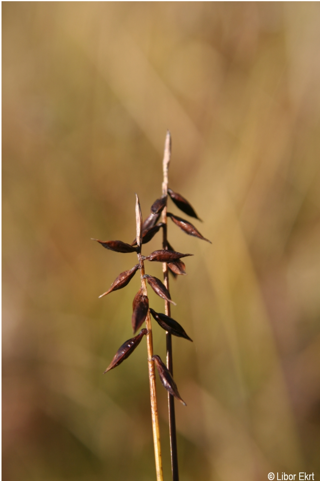
Carex pulicaris – Libor Ekrť – Hadí vrch.