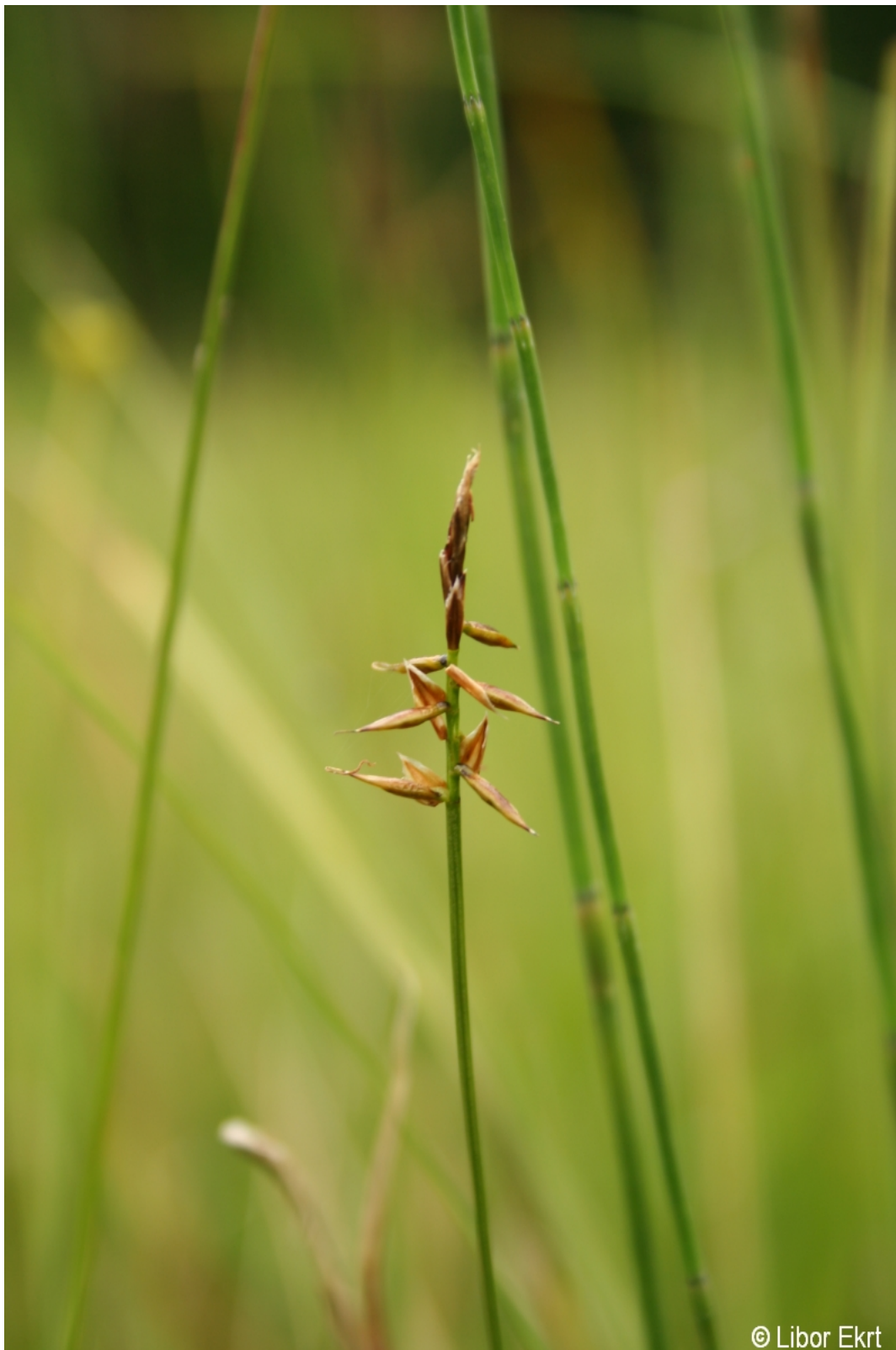
Carex pulicaris – Libor Ekrť – Strážný.