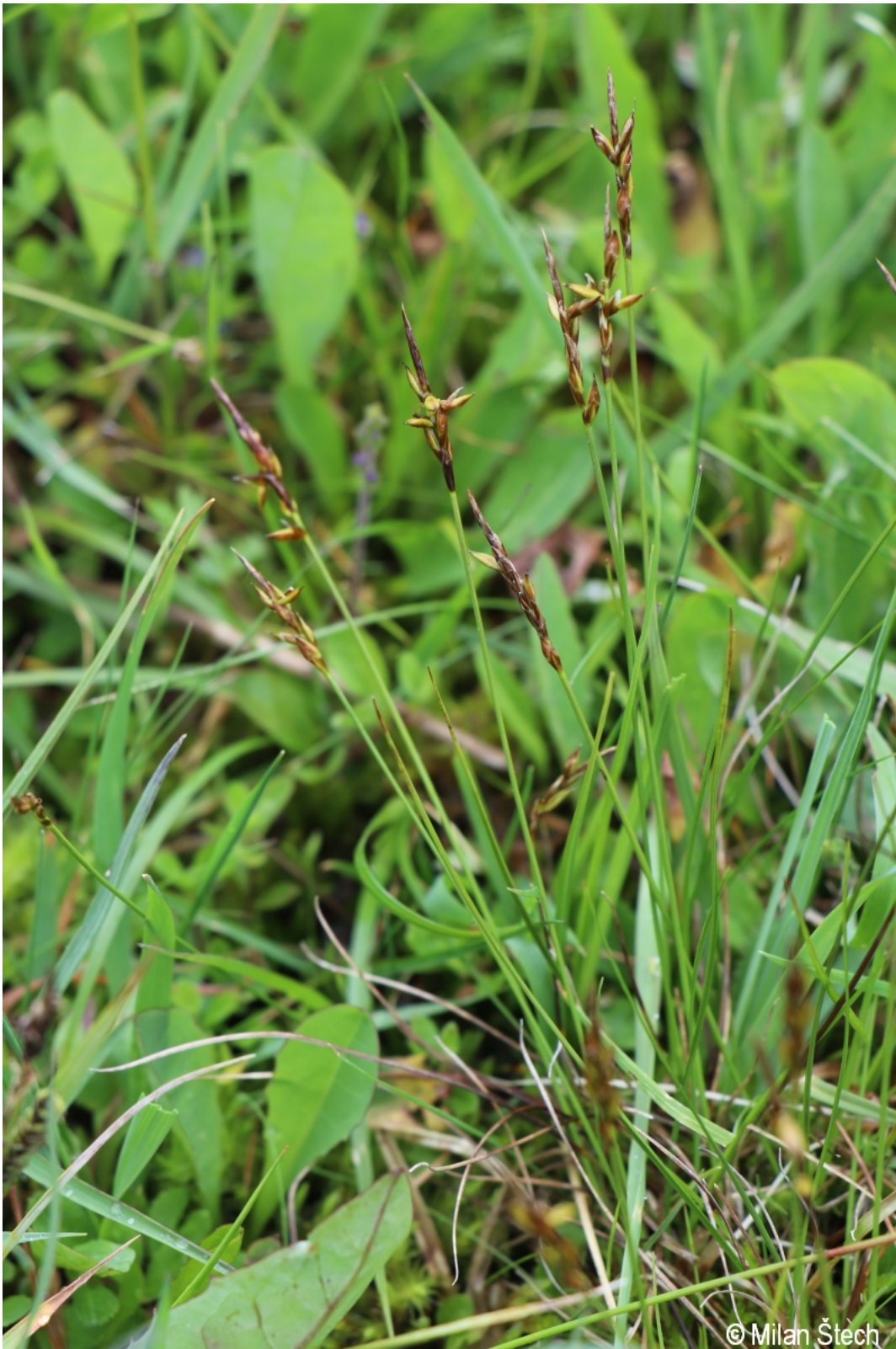
Carex pulicaris – Milan Štech – Kepelské Zhůří.