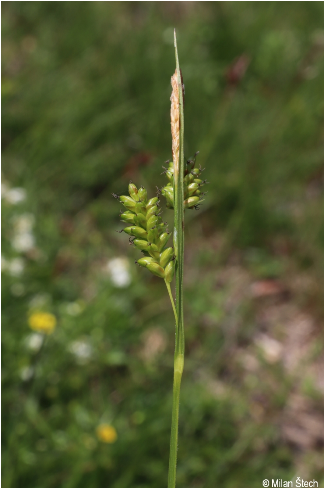
Carex pallescens – Milan Štech – Bischofsreut.