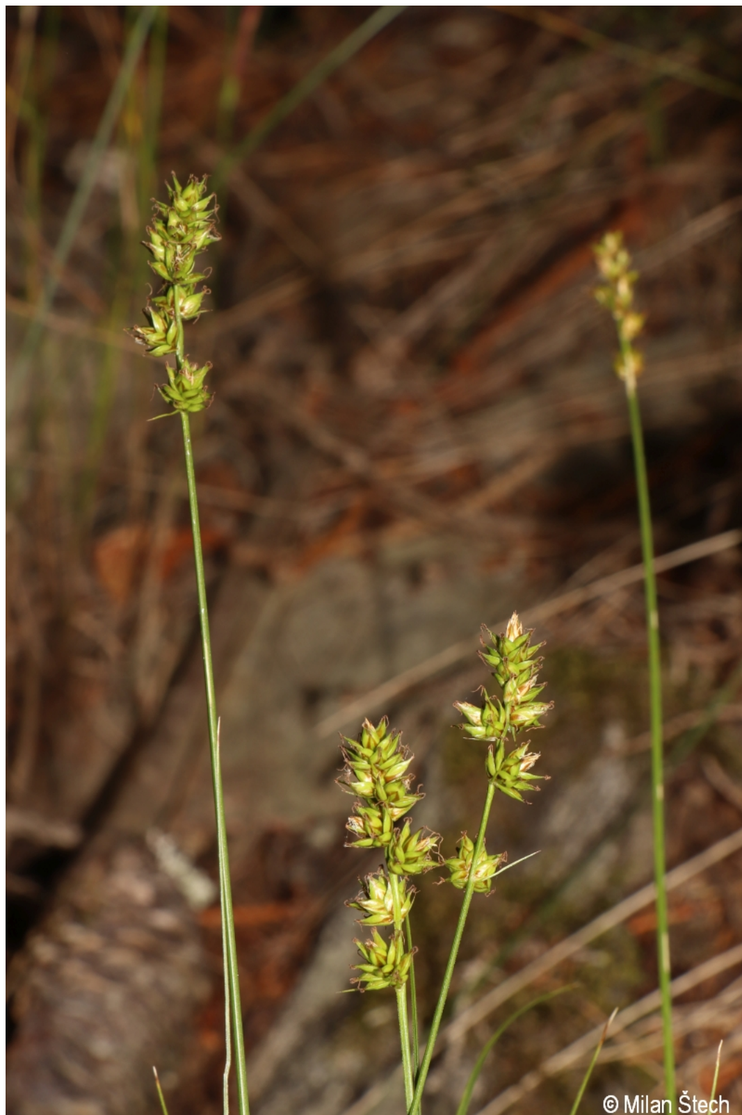
Carex pairae – Milan Štech – Svojše.