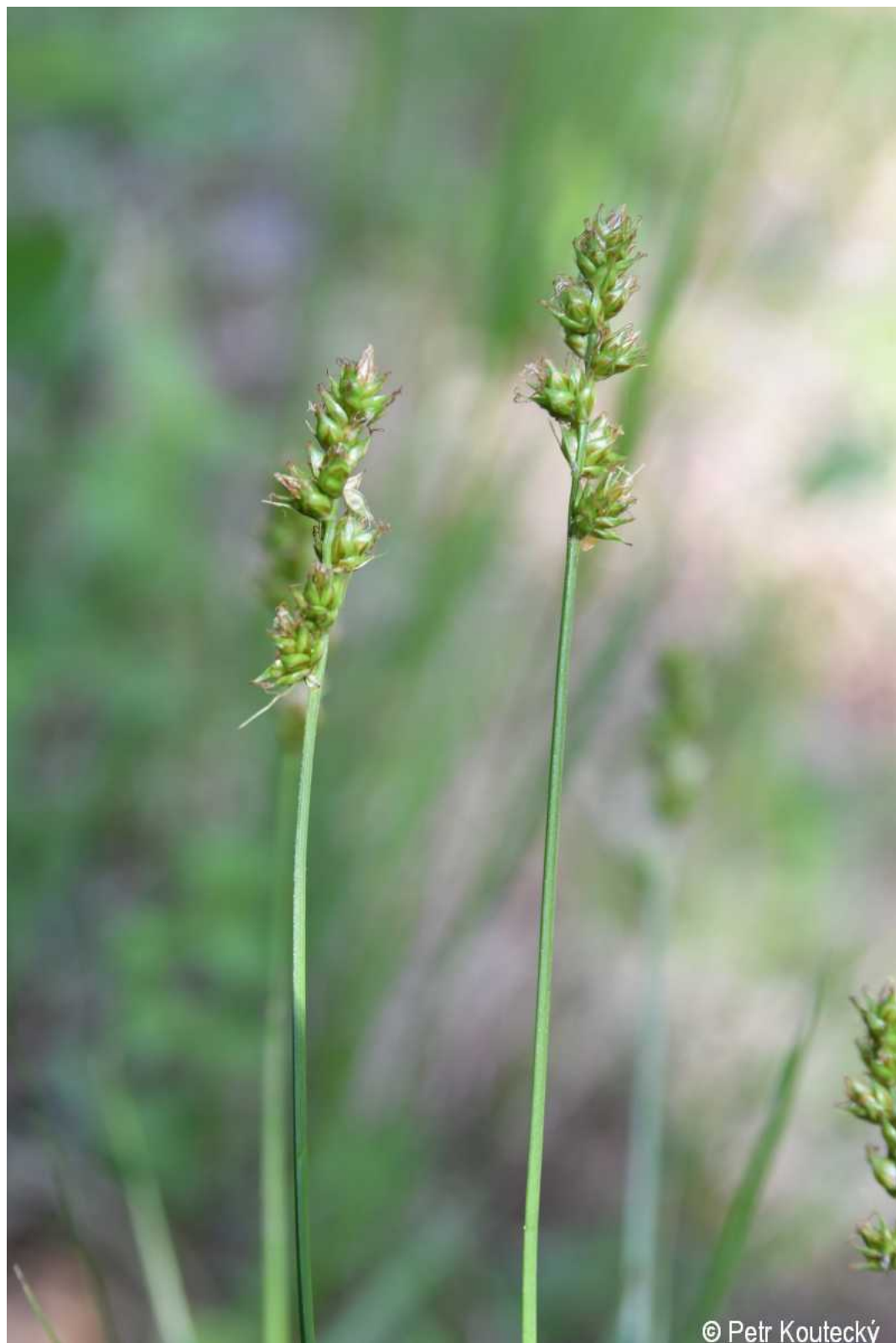
Carex pairae – Petr Koutecký – Jasánky.