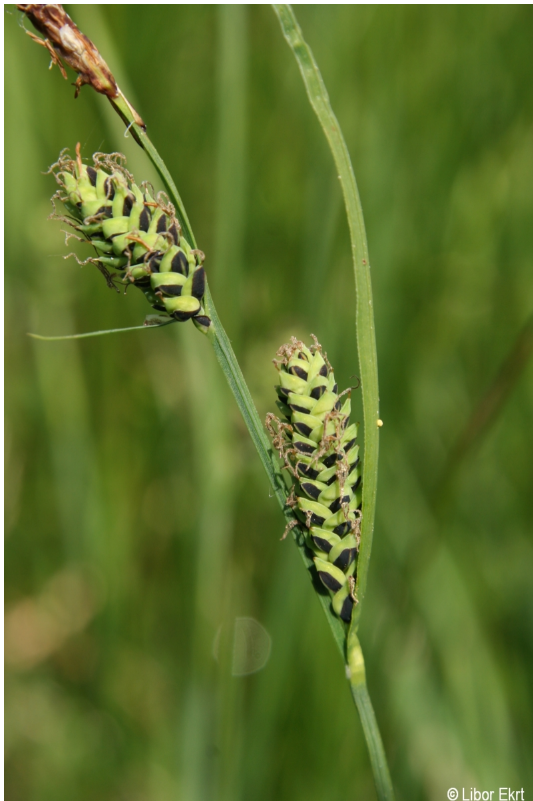
Carex nigra – Libor Ekrť – Chaloupky.