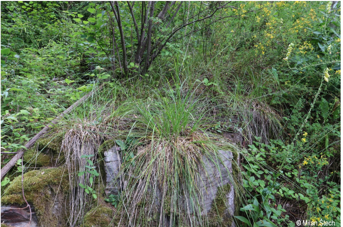
Carex muricata – Milan Štech – Jezevčí skála.