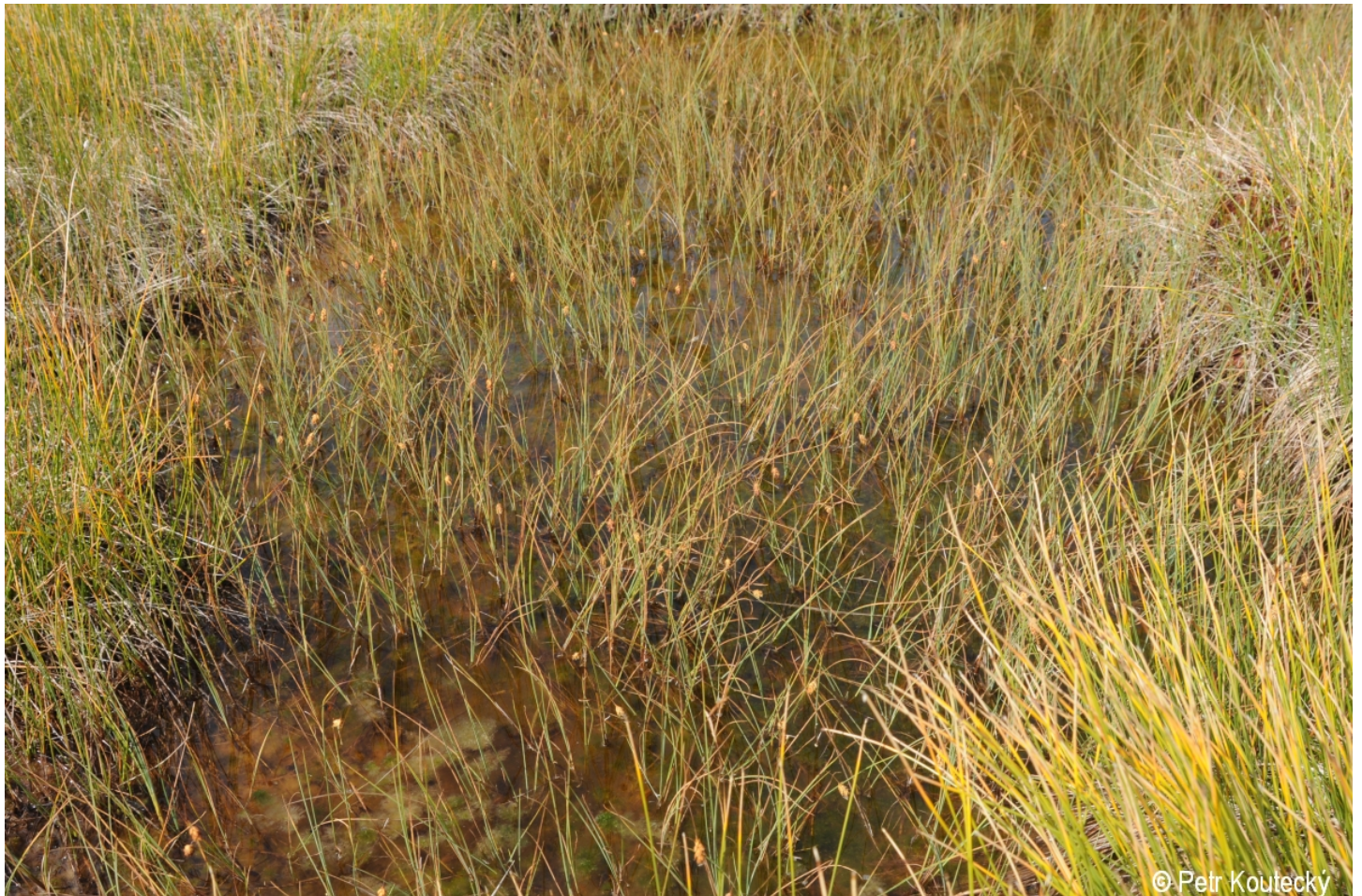
Carex limosa – Petr Kouřecký – Šárecká slat'.