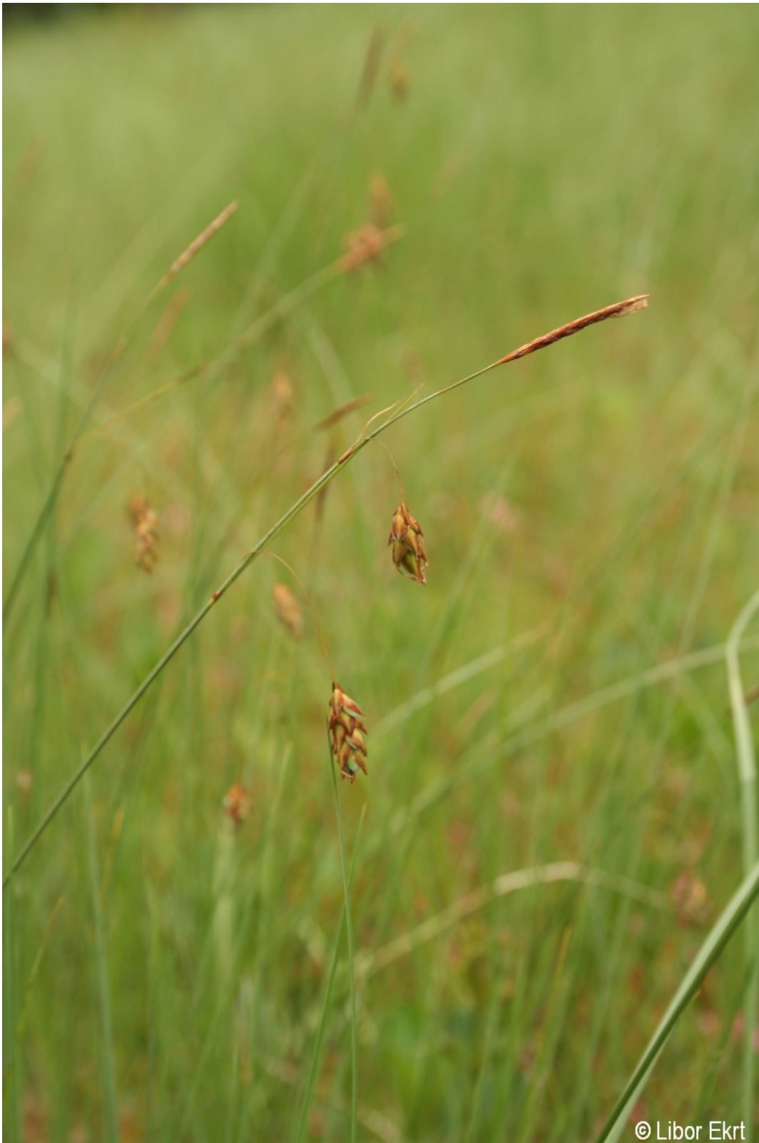
Carex limosa – Libor Ekrť – Kyselov.