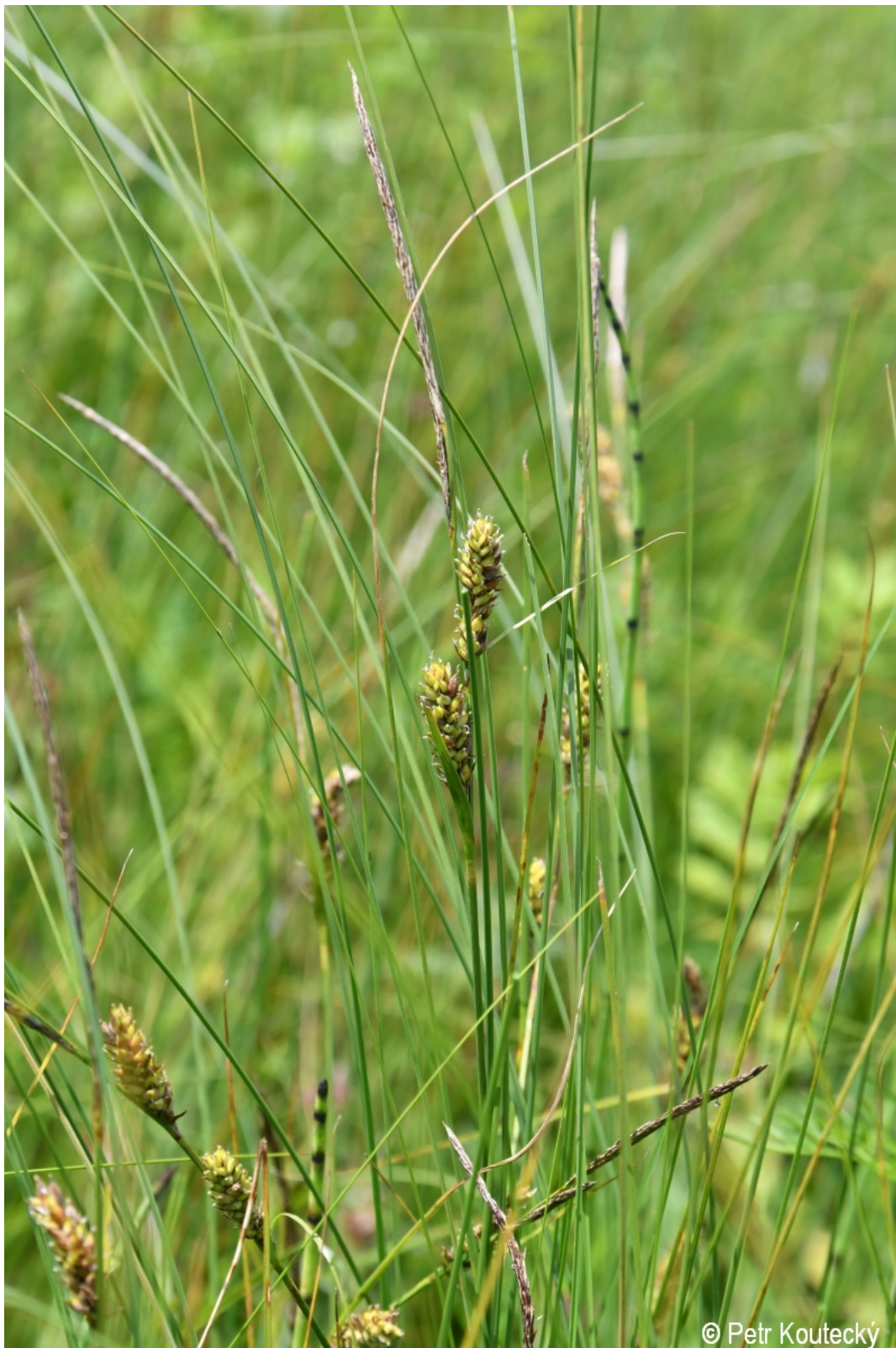
Carex lasiocarpa – Petr Koutecký – Dobrá, Vltavský luh.