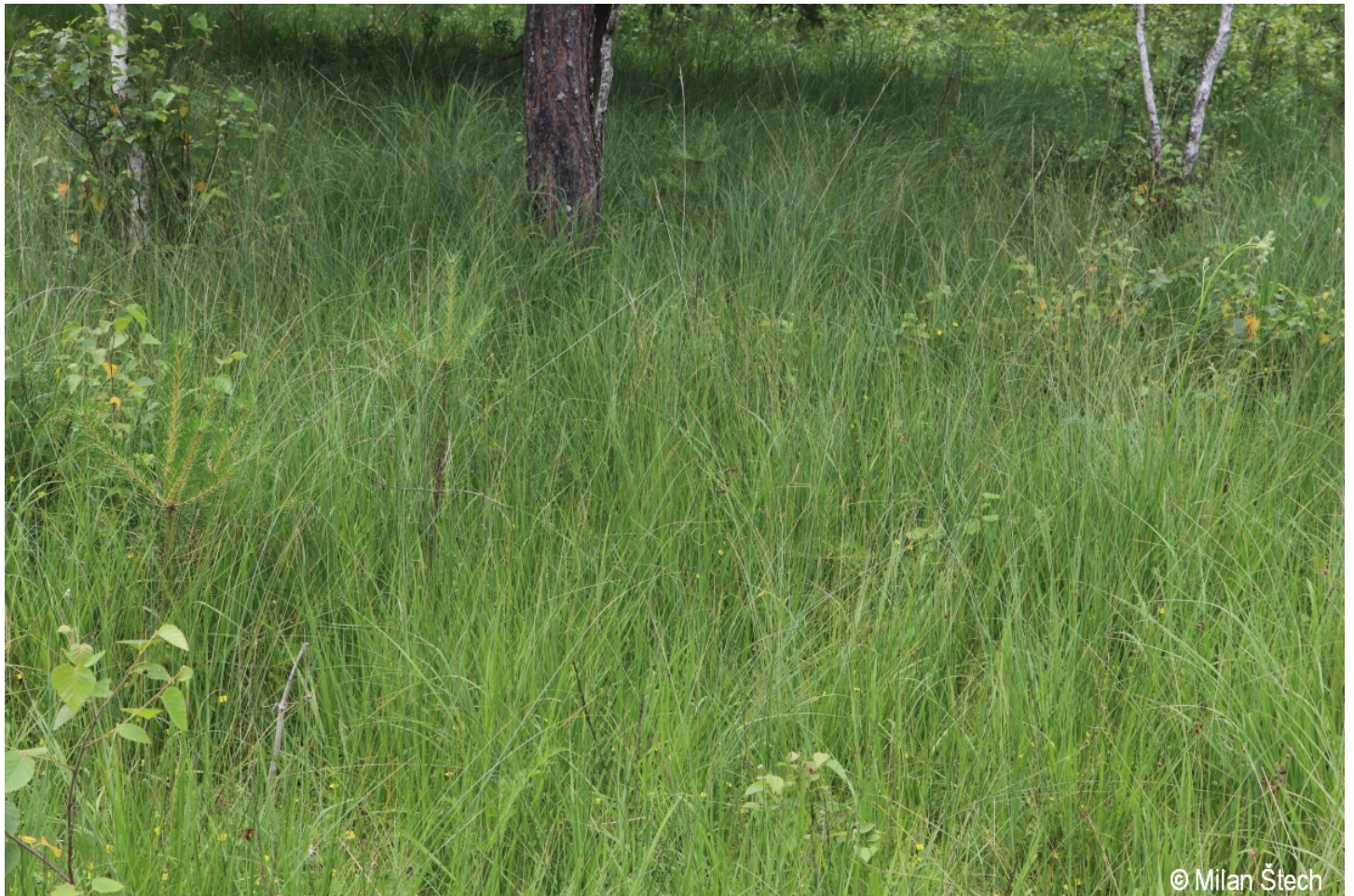
Carex lasiocarpa – Milan Štech – Záhvozdí.