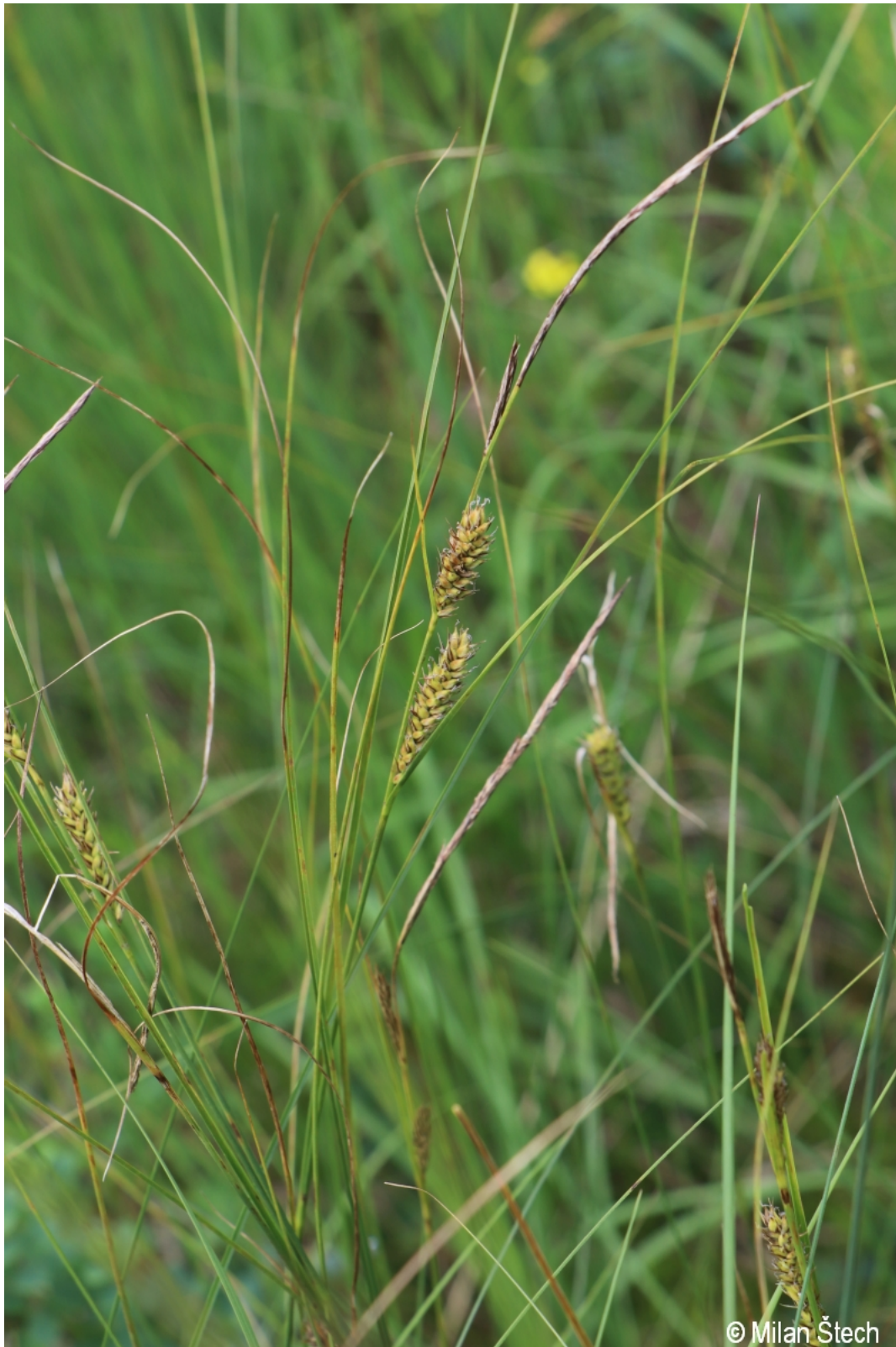
Carex lasiocarpa – Milan Štech – Záhvozdí.