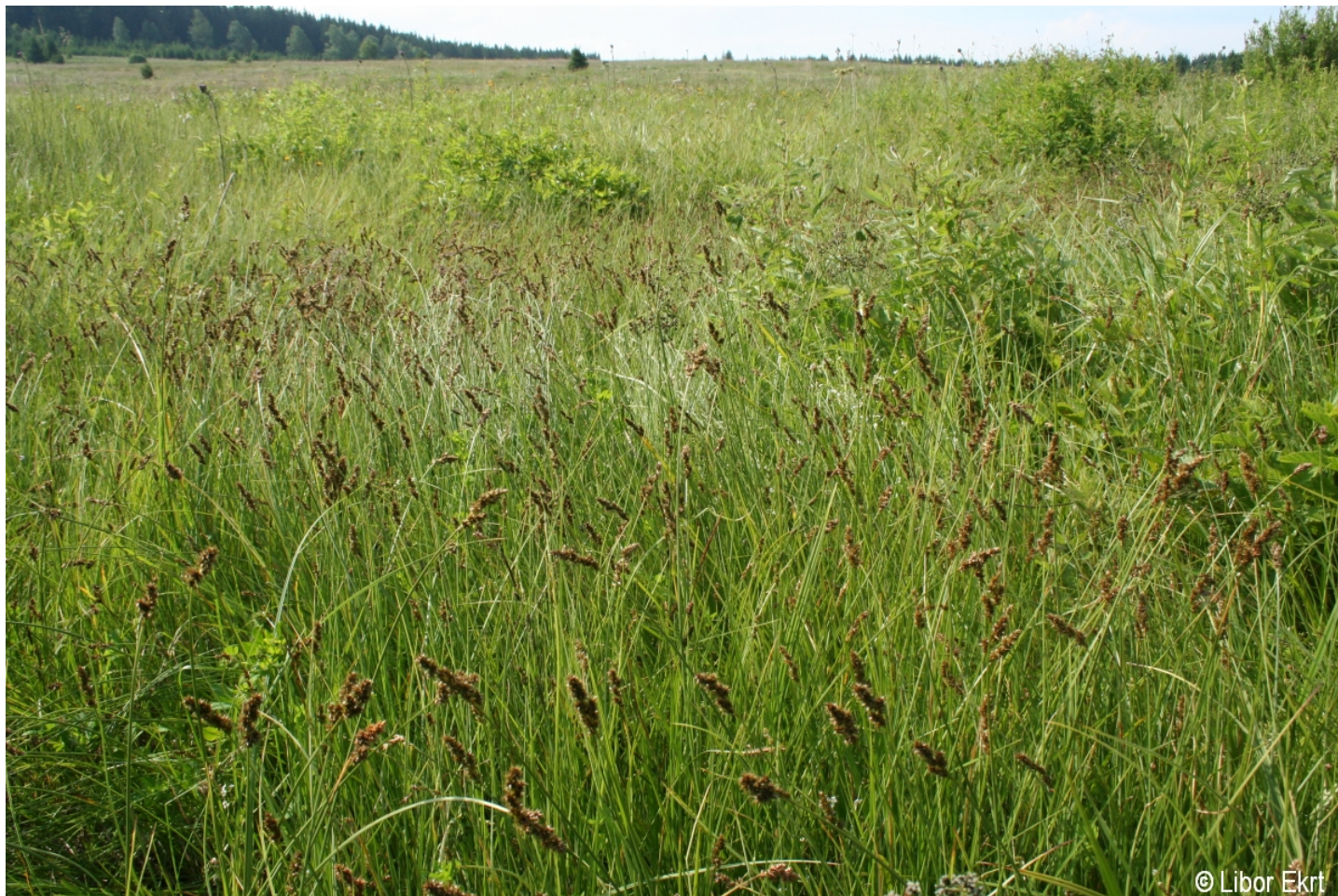
Carex diandra – Libor Ekrť – Kepelské Zhůří.