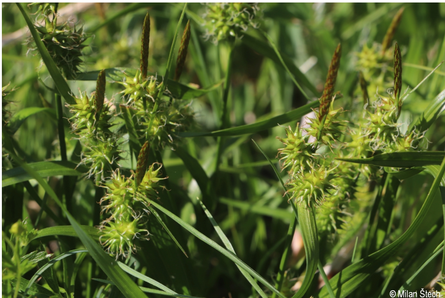
Carex demissa – Milan Štech – Smrčina.