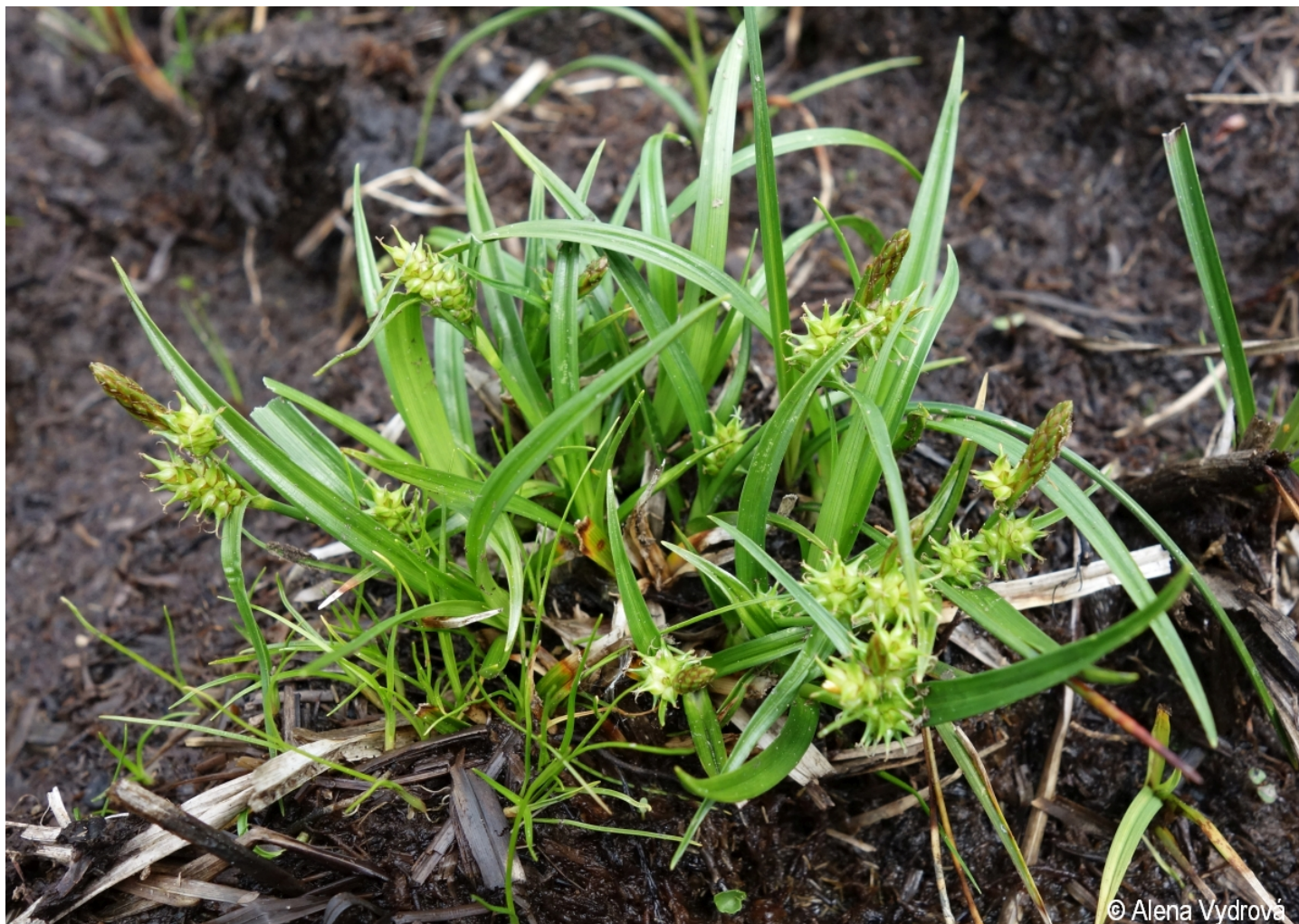
Carex demissa – Alena Vydrová – Borová Lada.