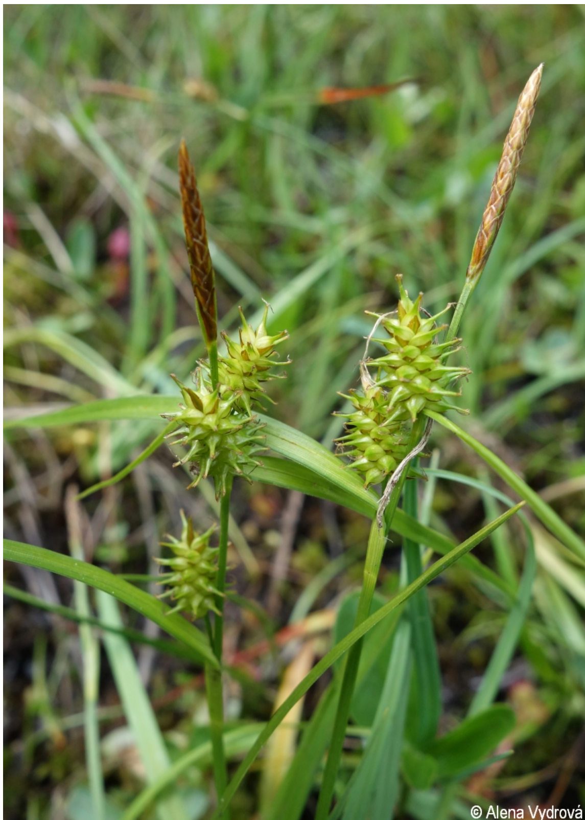
Carex demissa – Alena Vydrová – Borová Lada.