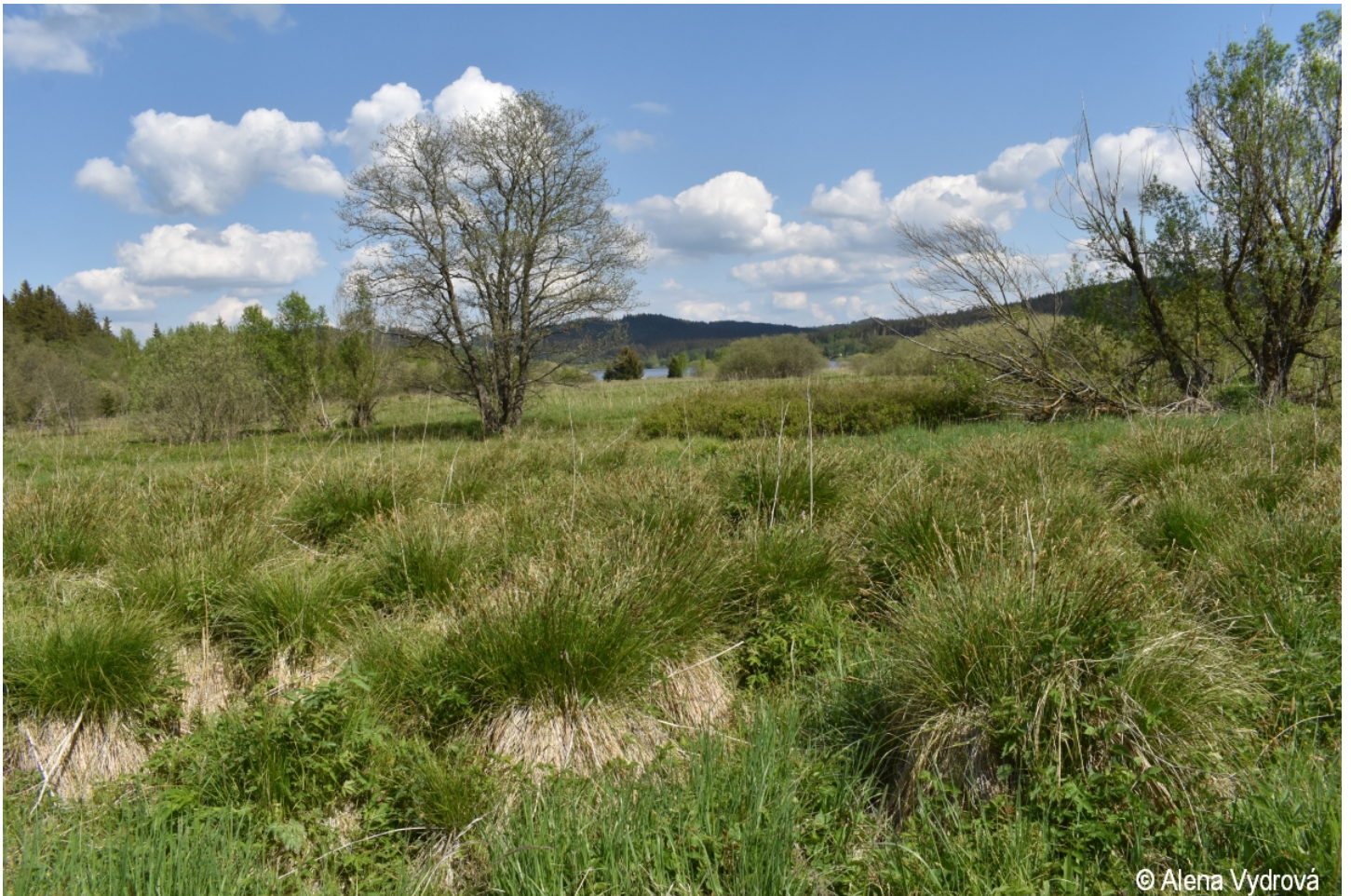
Carex appropinquata – Alena Vydrová – Olšina.