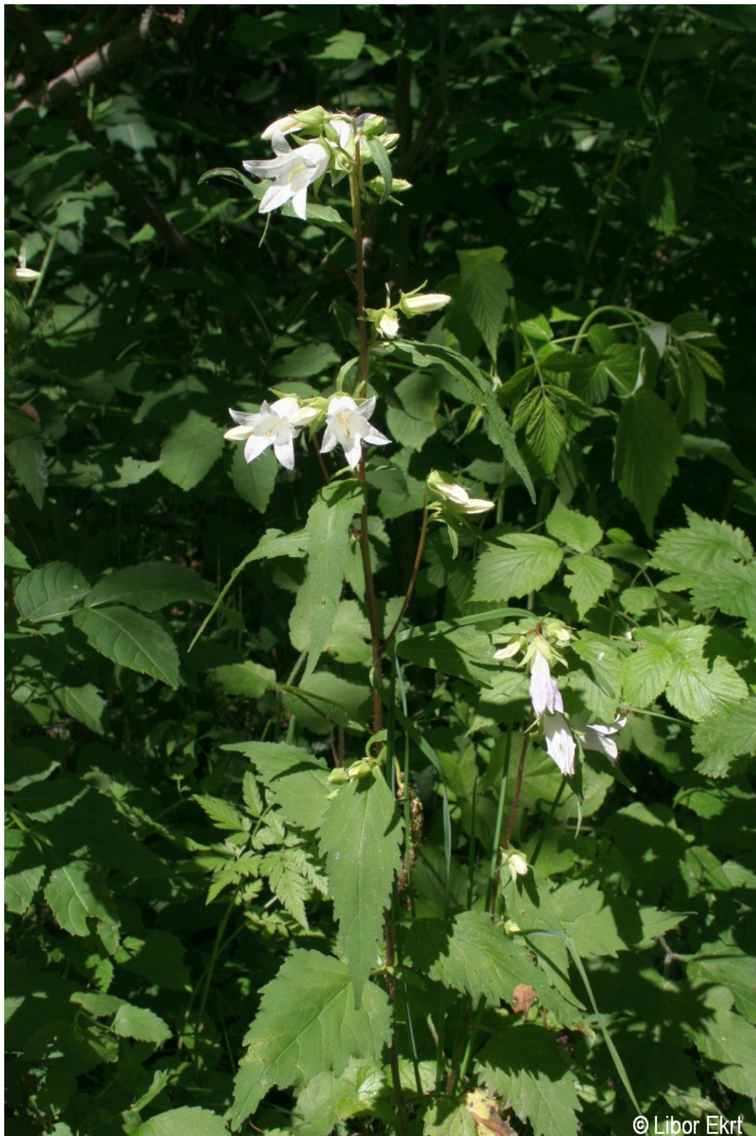
Campanula trachelium – Libor Ekrt – Paště.