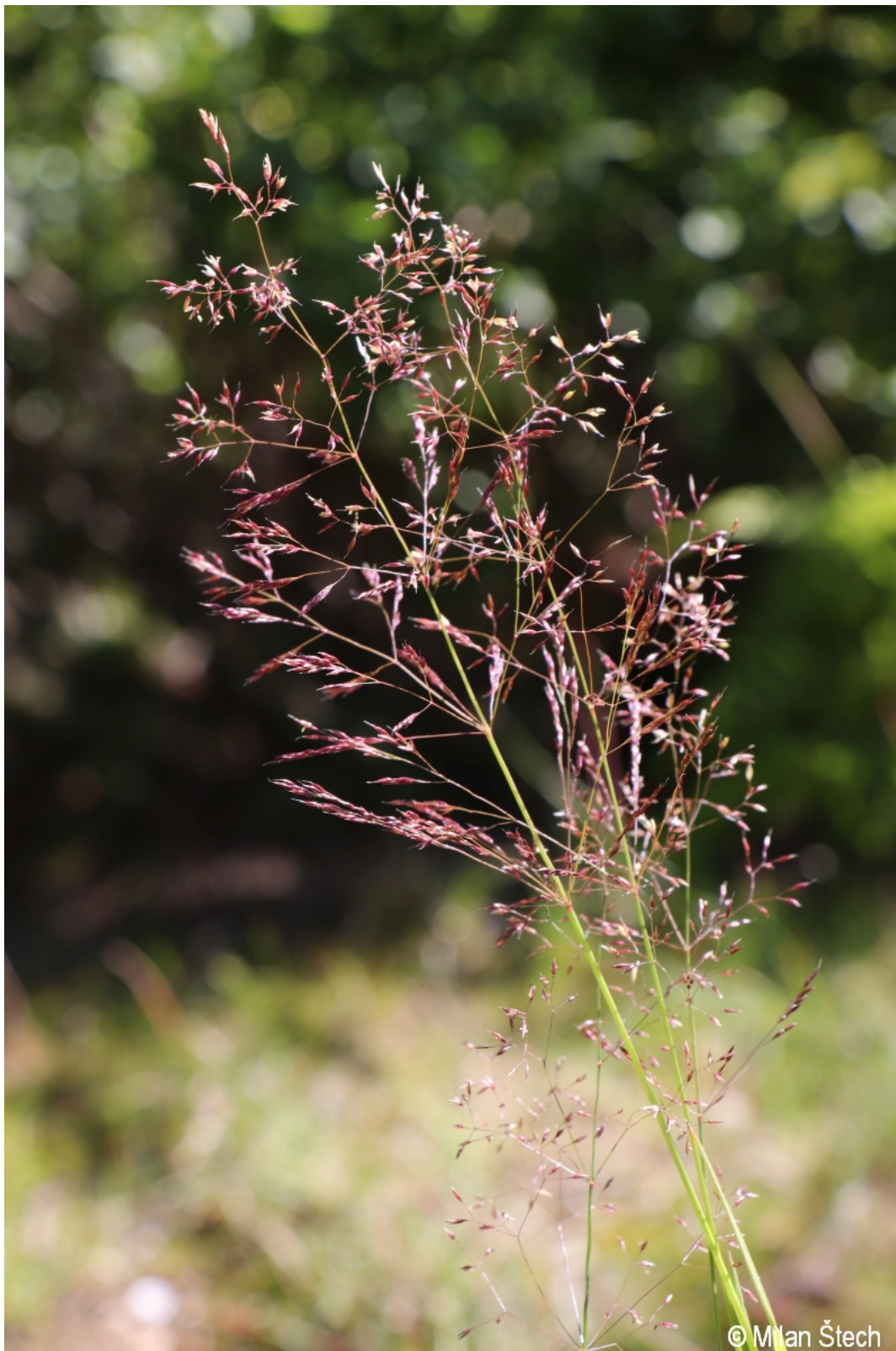
Agrostis capillaris – Milan Štech – Třístoličník.