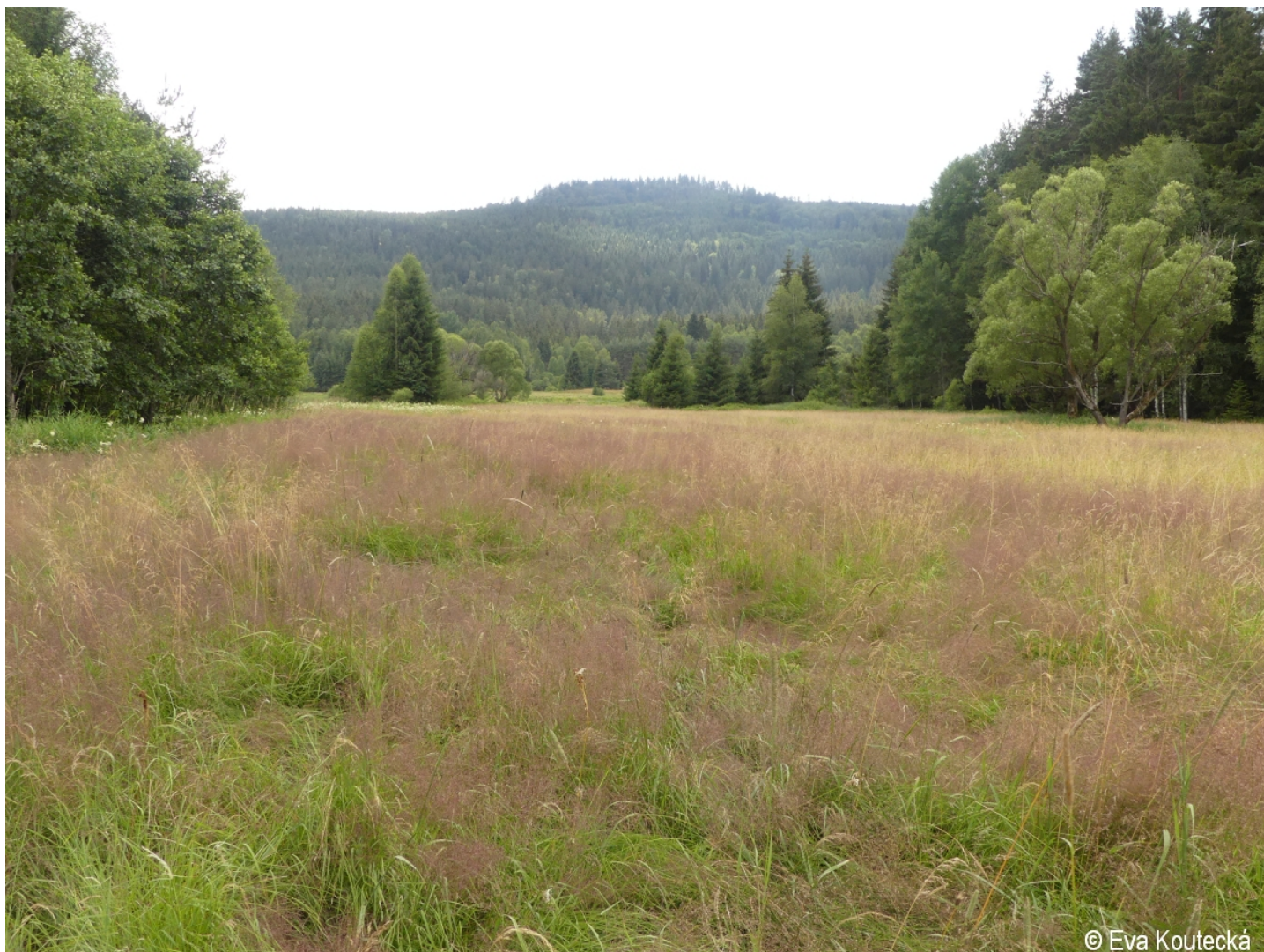
Agrostis capillaris – Eva Koutecká – Pěkná.