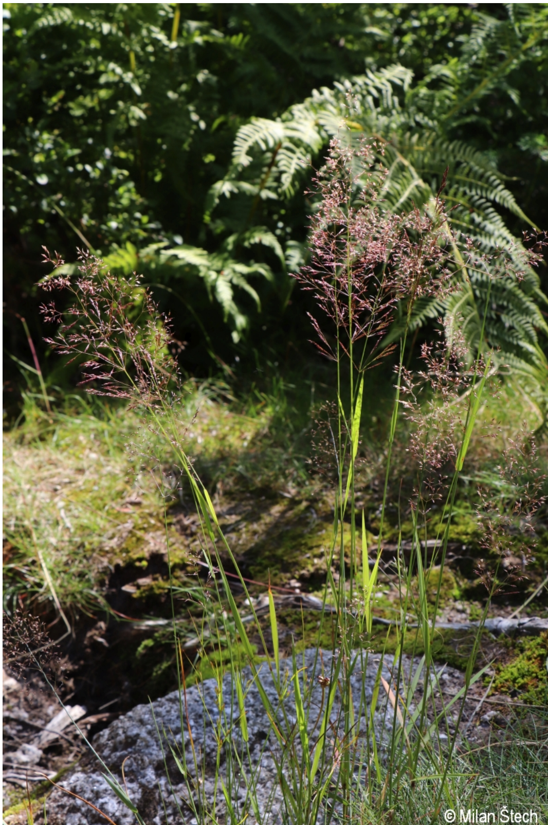
Agrostis capillaris – Milan Štech – Třístoličník.