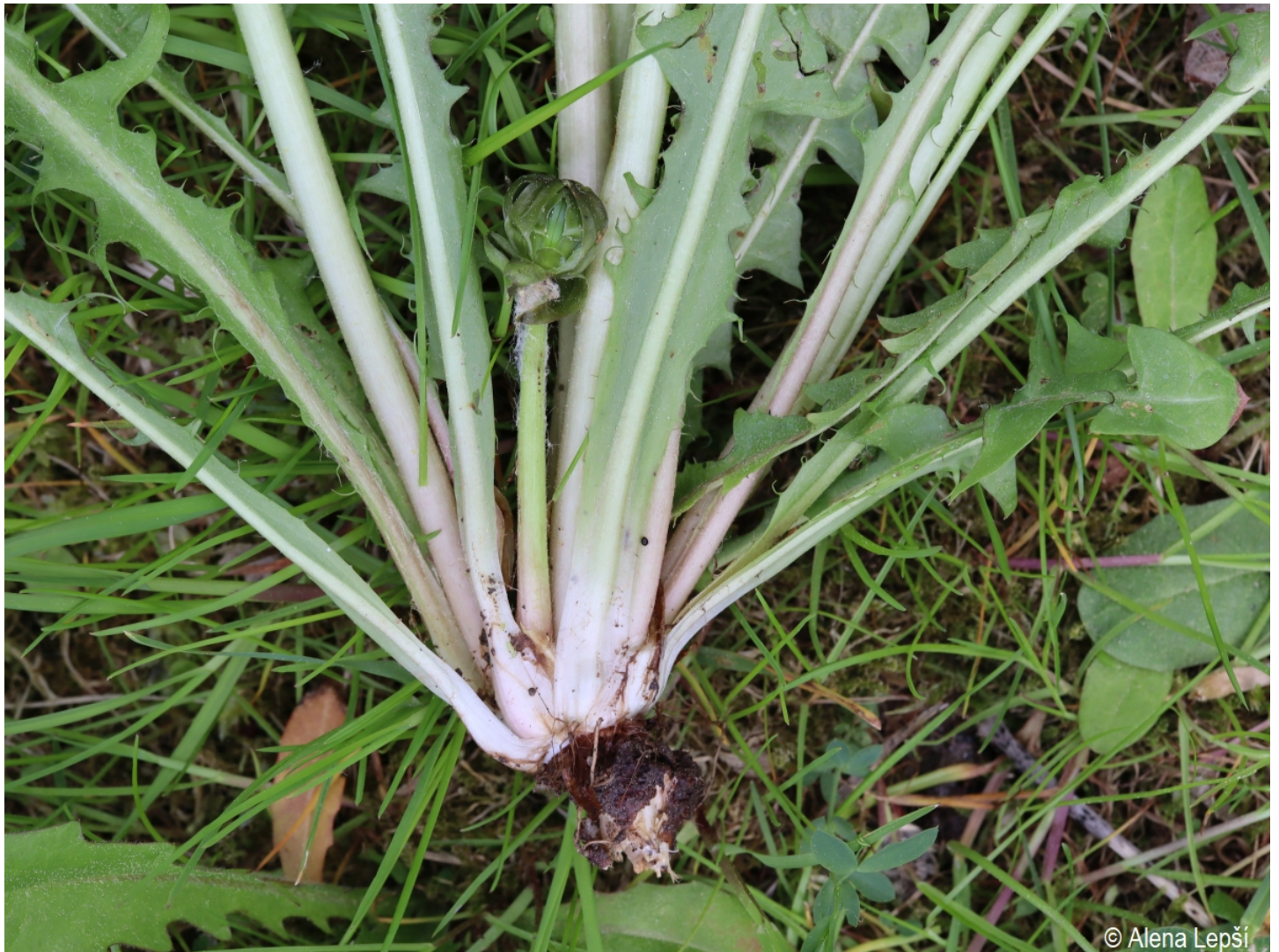
Taraxacum clarum – Alena Lepší – Hartmanice.