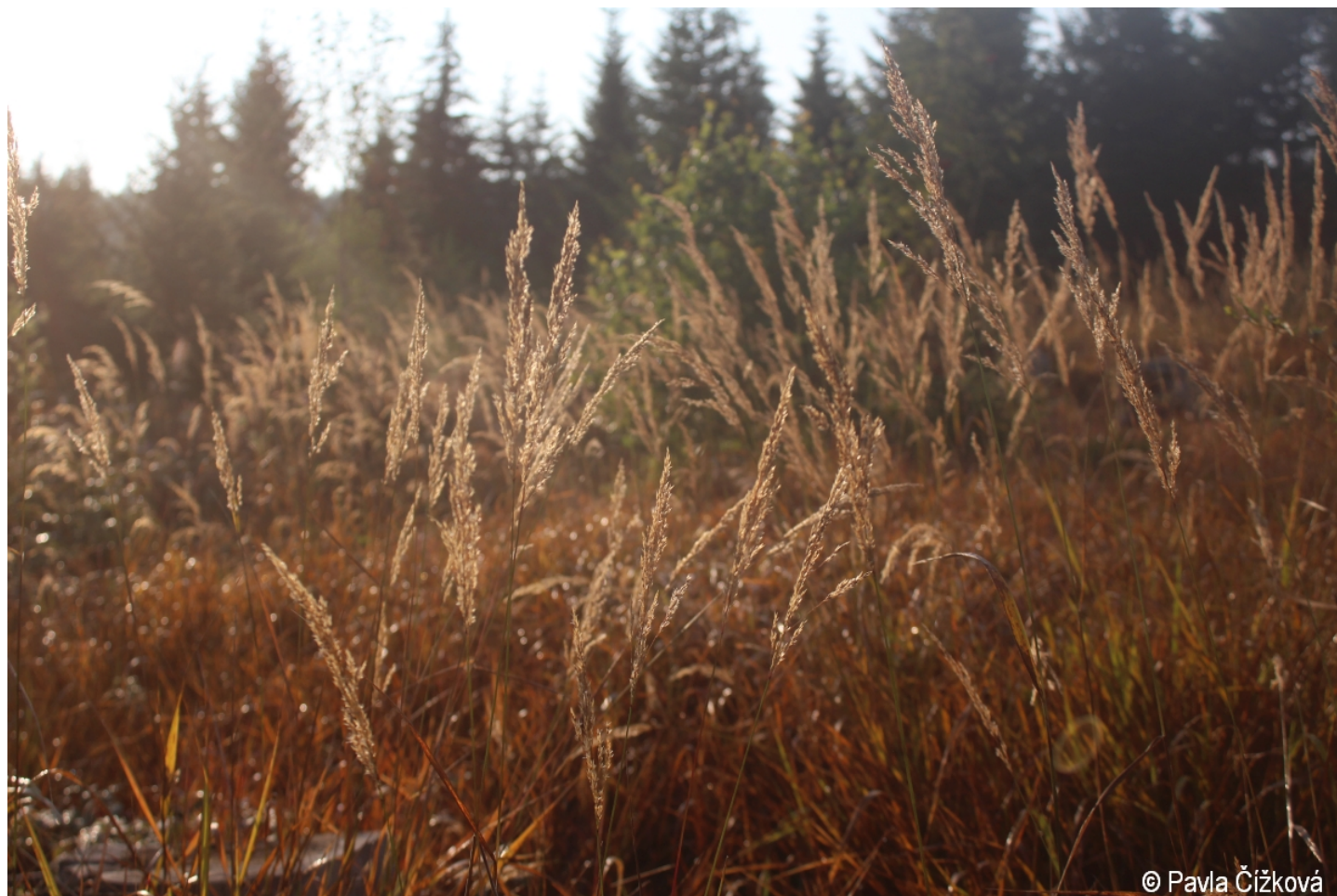
Calamagrostis villosa – Pavla Čížková – Laka.