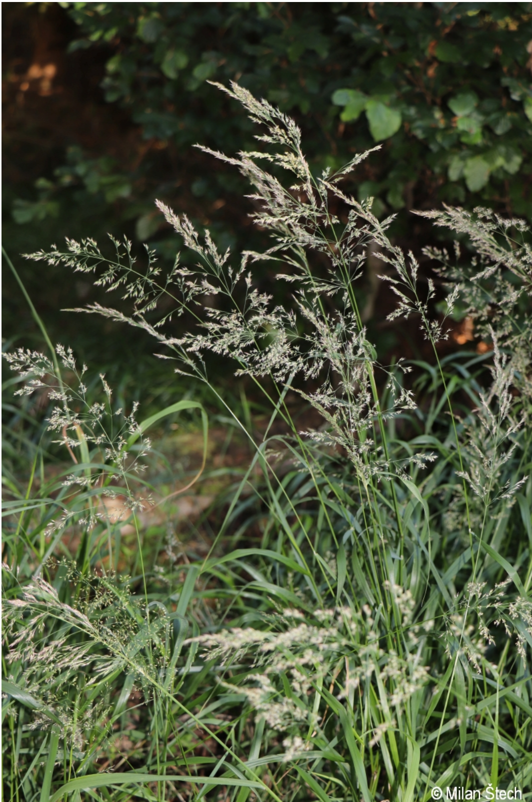
Calamagrostis villosa – Milan Štech – Horská Kvilda, Stará Huť u Zhůří.