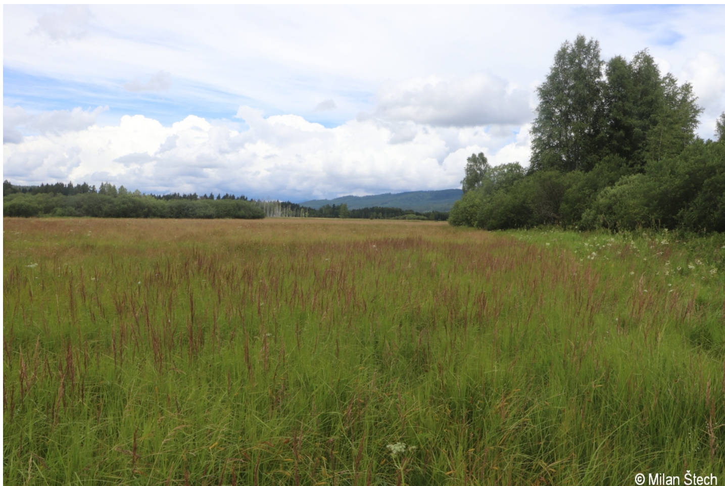
Calamagrostis canescens – Milan Štech – Želnavá.