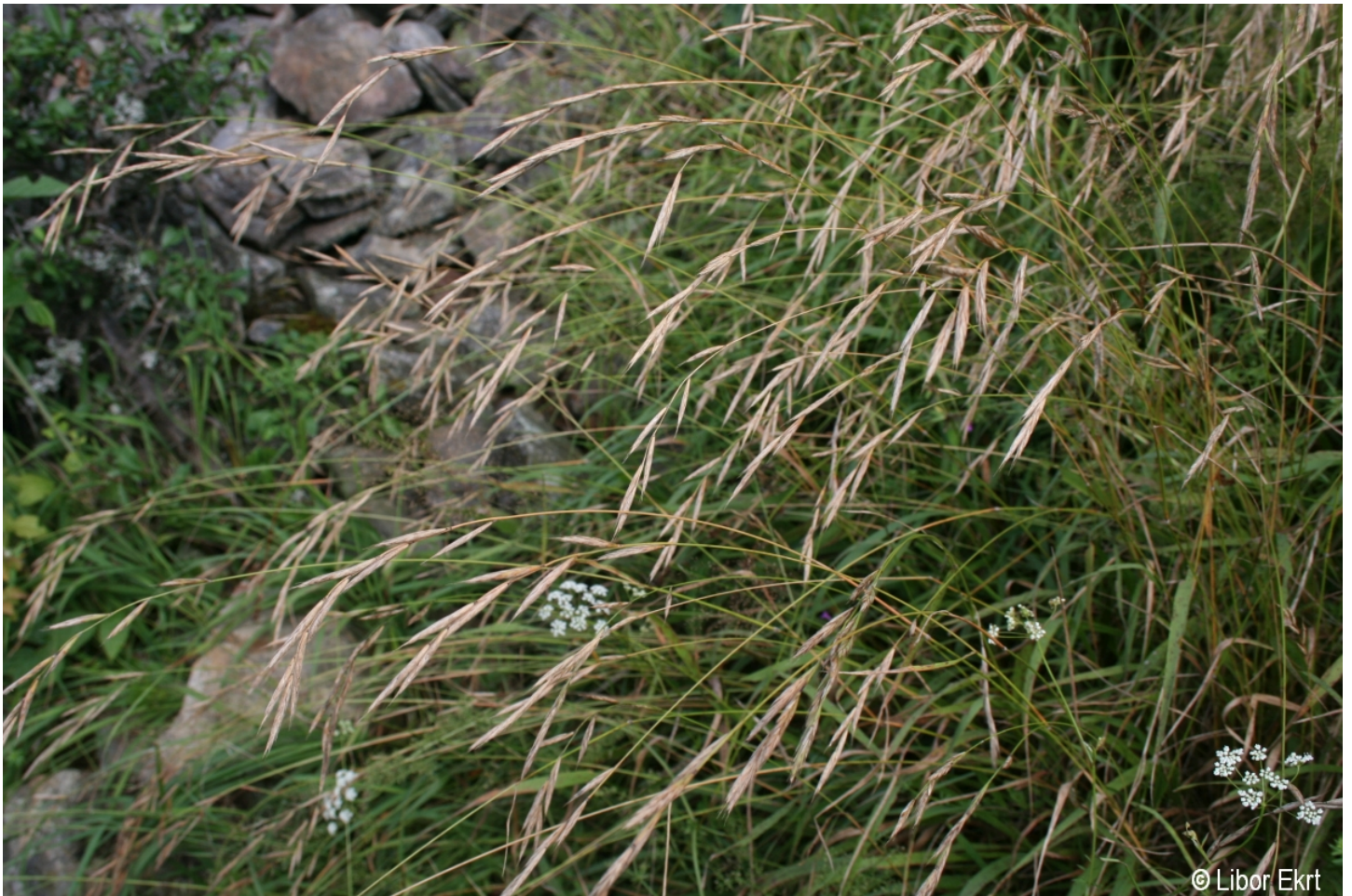
Brachypodium pinnatum – Libor Ekrt – Rejštejn.