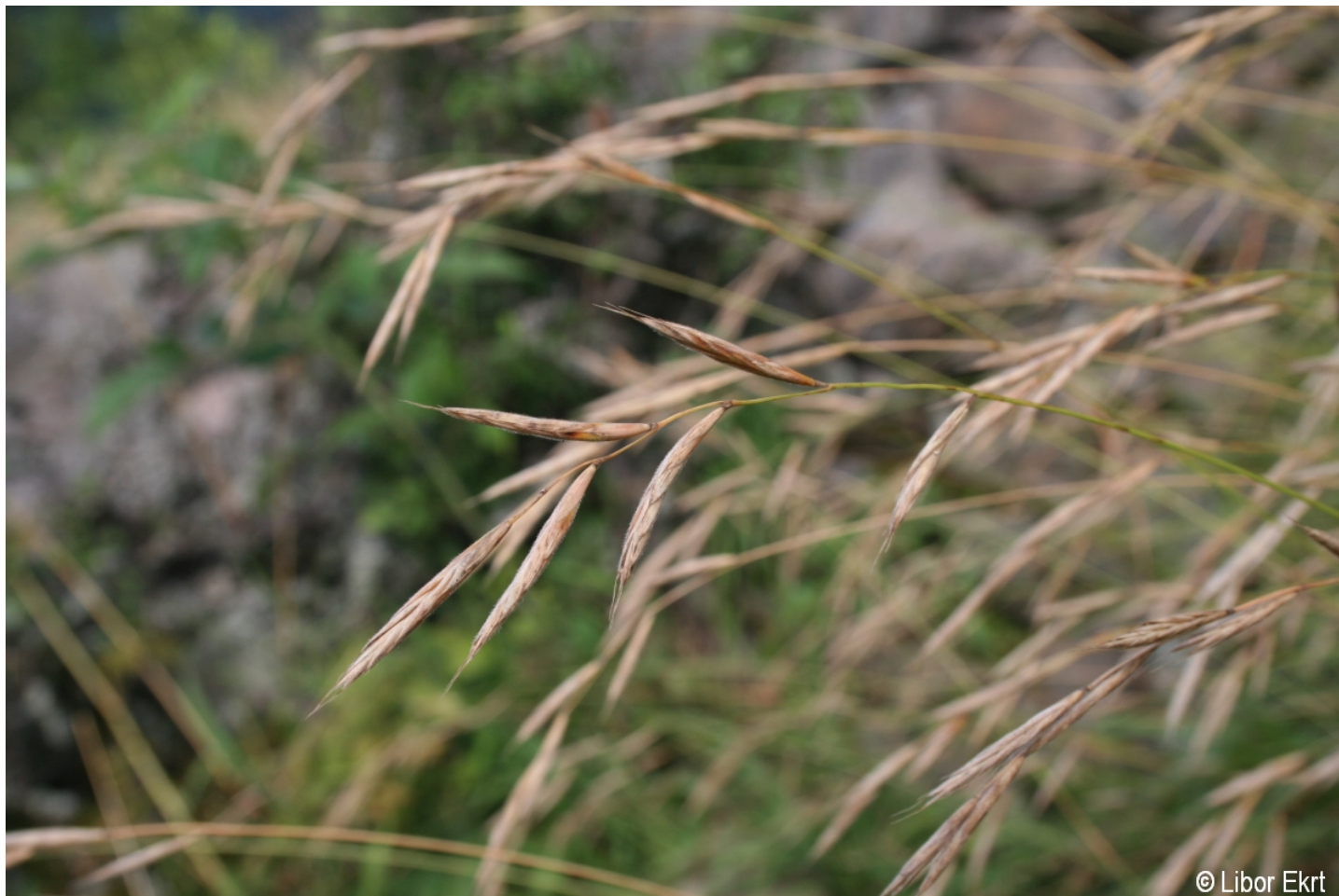
Brachypodium pinnatum – Libor Ekrt – Rejštejn.