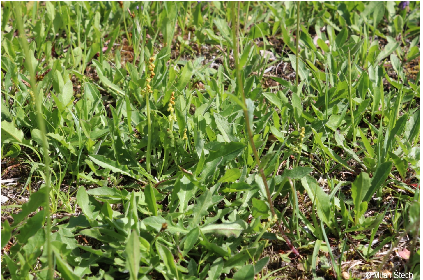
Botrychium lunaria – Milan Štech – Bischofsreut.