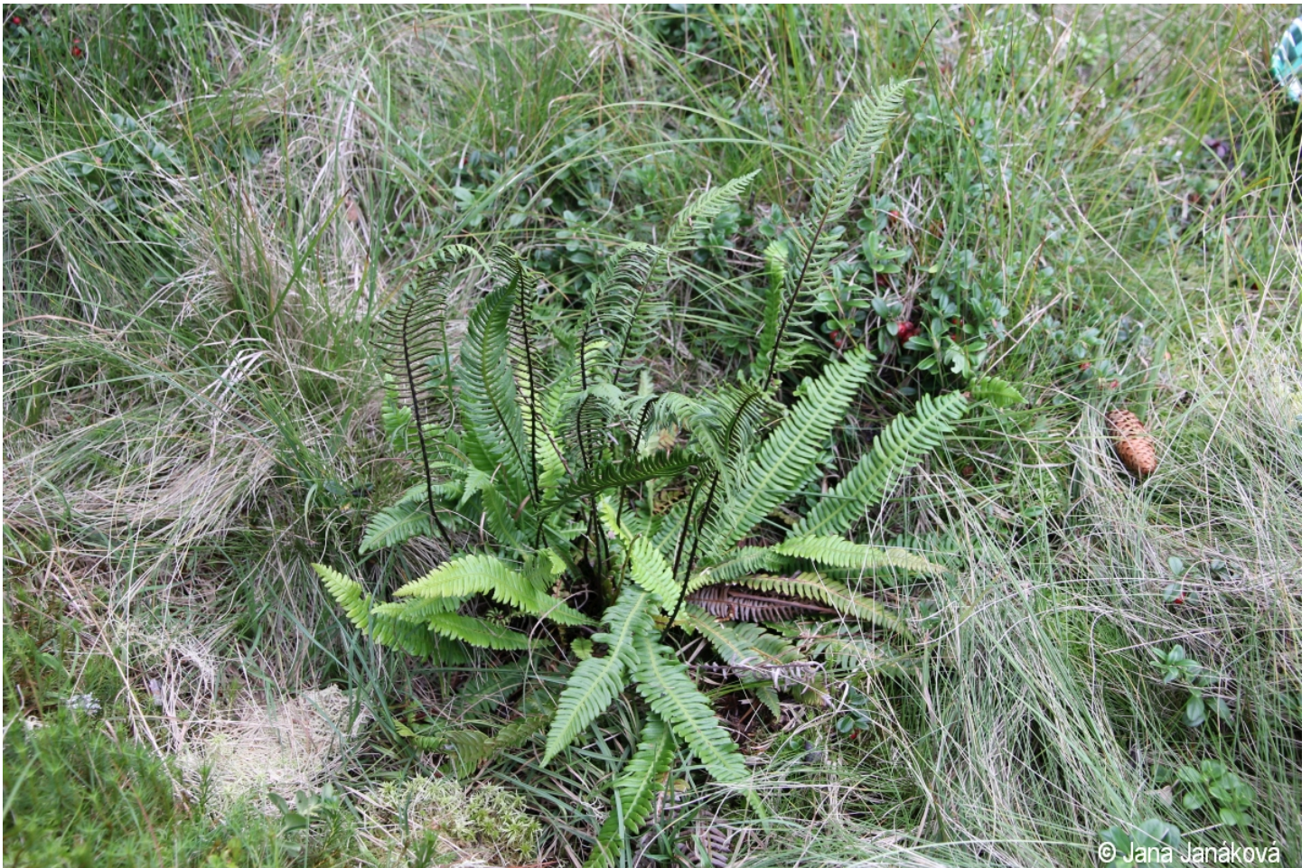
Blechnum spicant – Jana Janáková – Menší Vltavice.