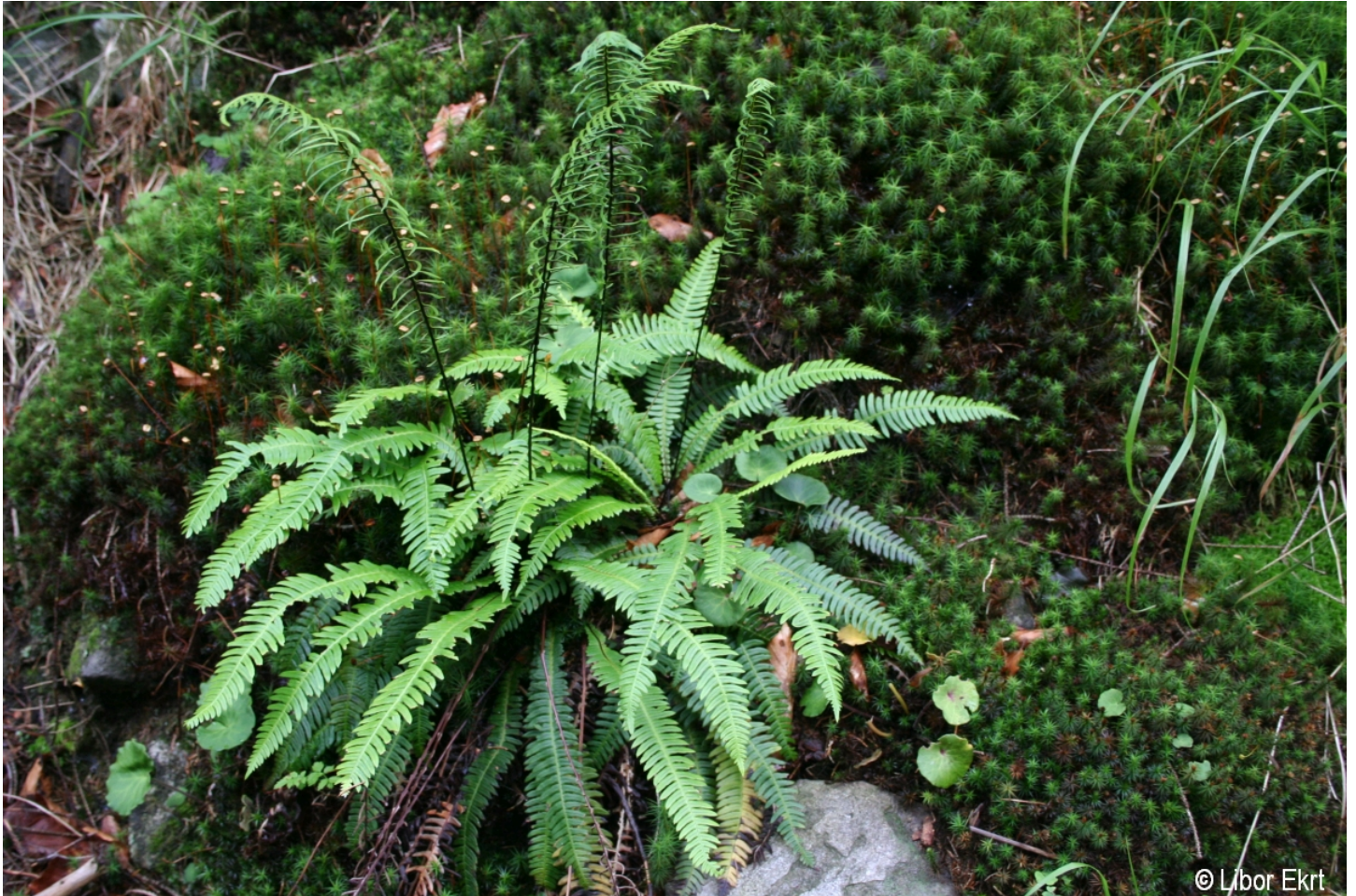
Blechnum spicant – Libor Ekrt – Poledník.