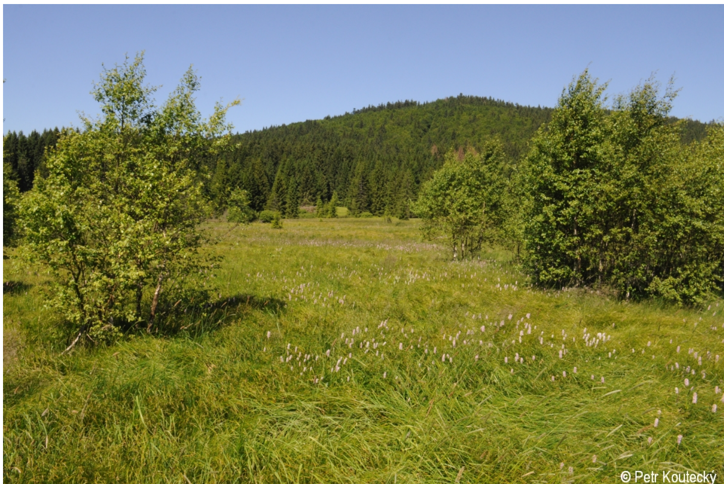
Bistorta officinalis – Petr Koutecký – Zadní Zvonková.