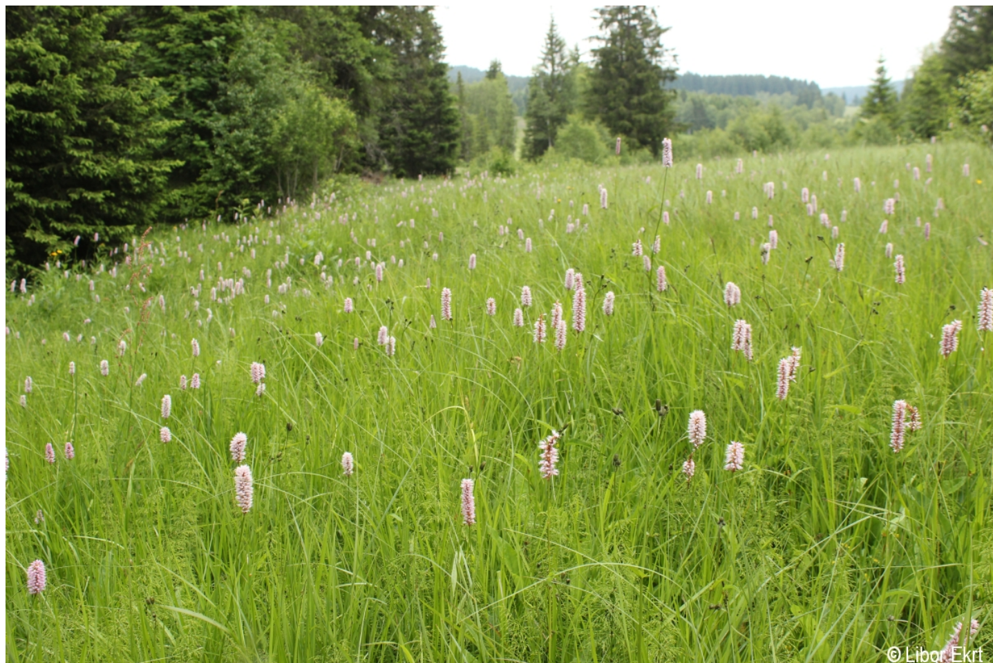
Bistorta officinalis – Libor Ekrť – Kvilda.