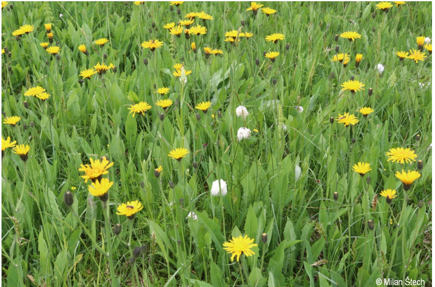
Willemetia stipitata – Milan Štech – Philippsreut.