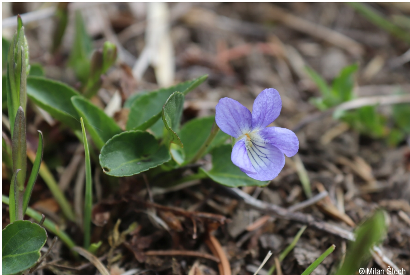
Viola riviniana – Milan Štech – Hajný vrch.