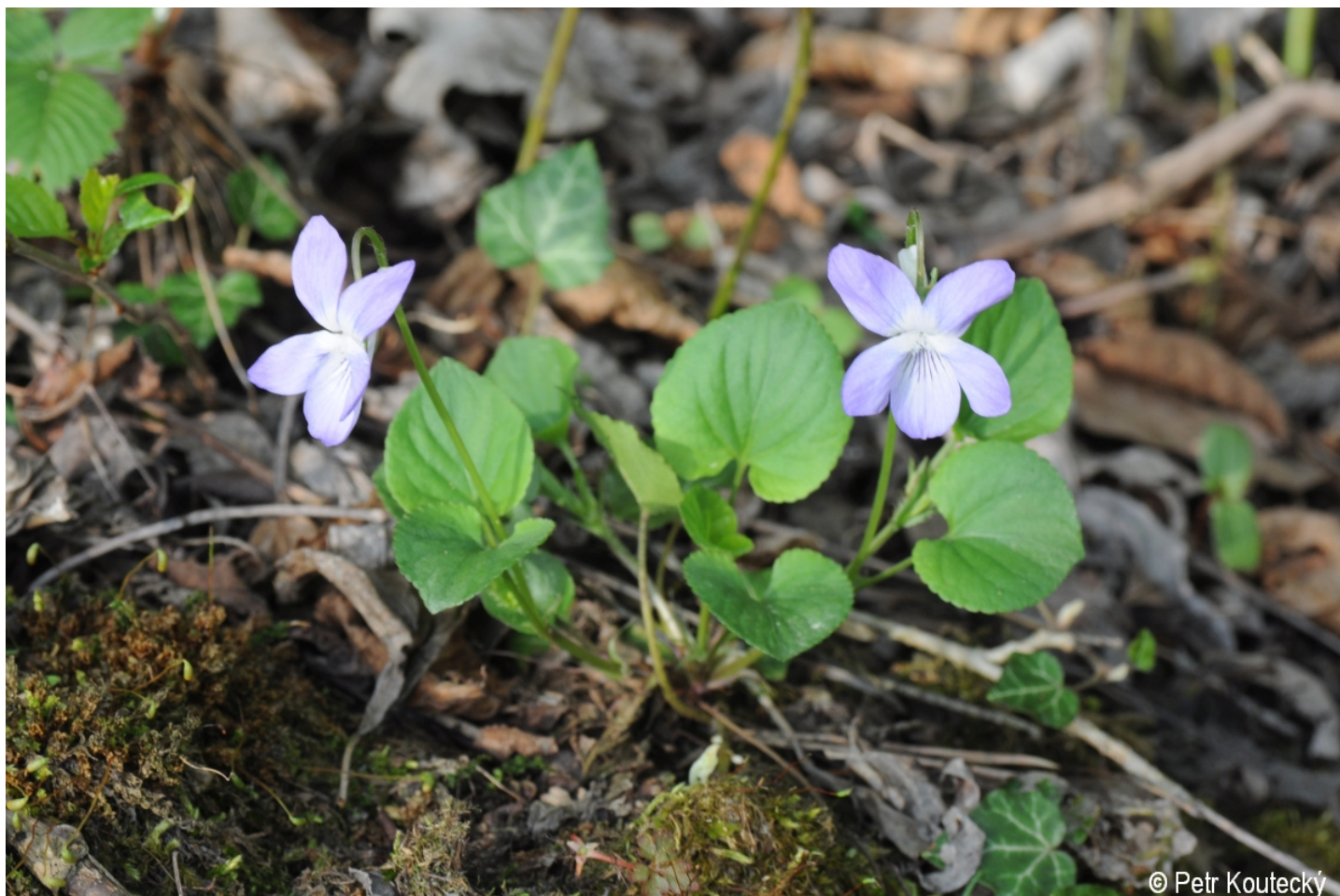
Viola riviniana – Petr Koutecký – Vimperk, Opolenec.