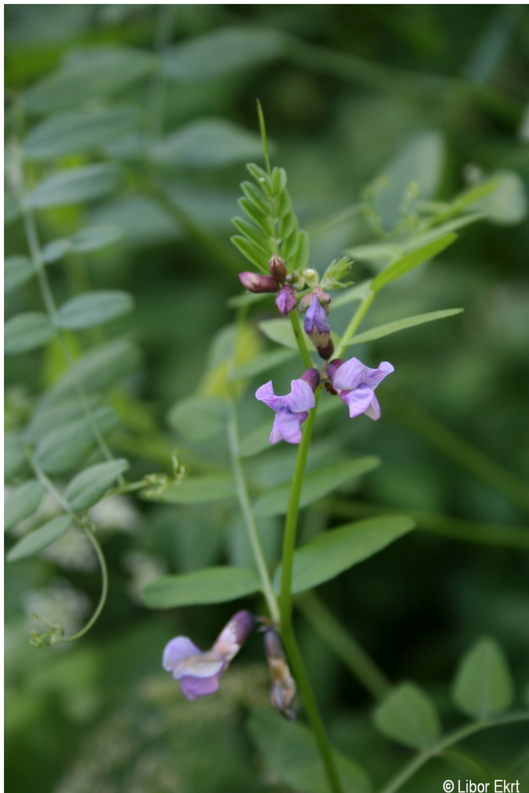
Vicia sepium – Libor Ekrť – Paště.