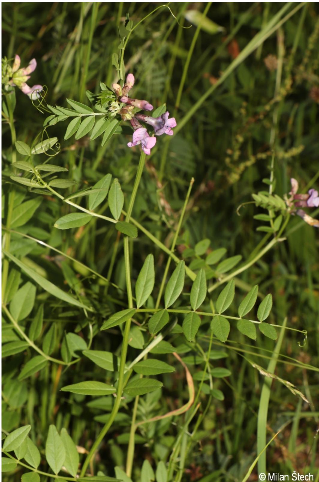
Vicia sepium – Milan Štech – Svojše.