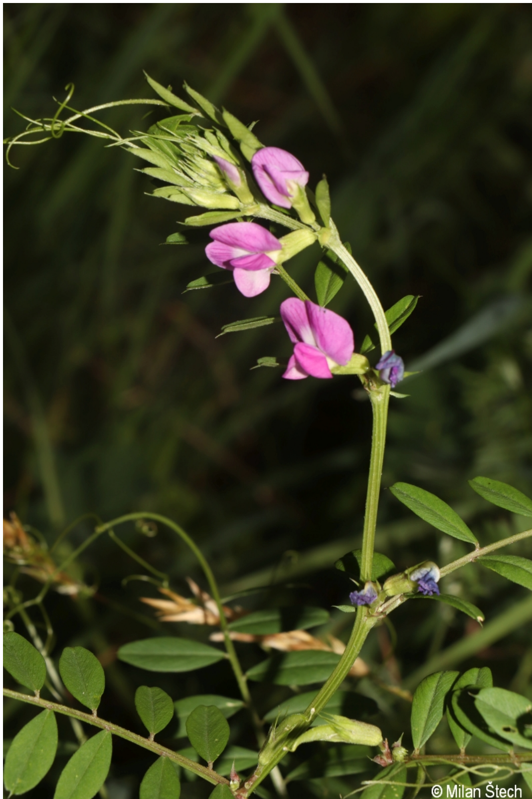
Vicia sativa agg. – Milan Štech – Svojše.