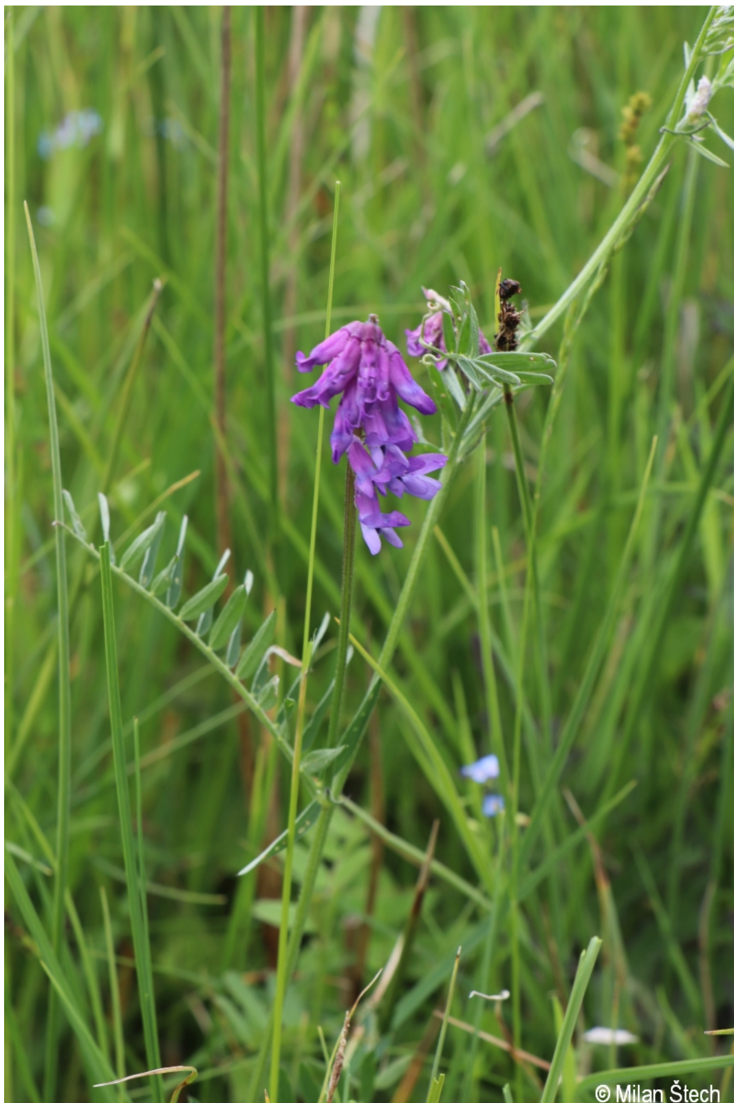
Vicia cracca – Milan Štech – Červený potok.