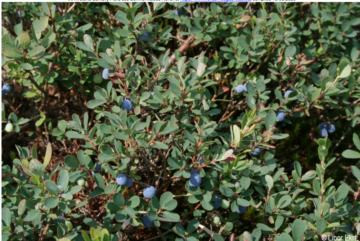
Vaccinium uliginosum – Libor Ekrt – Světlé Hory.