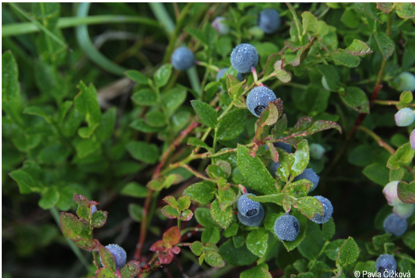
Vaccinium myrtillus – Pavla Čížková – Velká Mokrůvka.