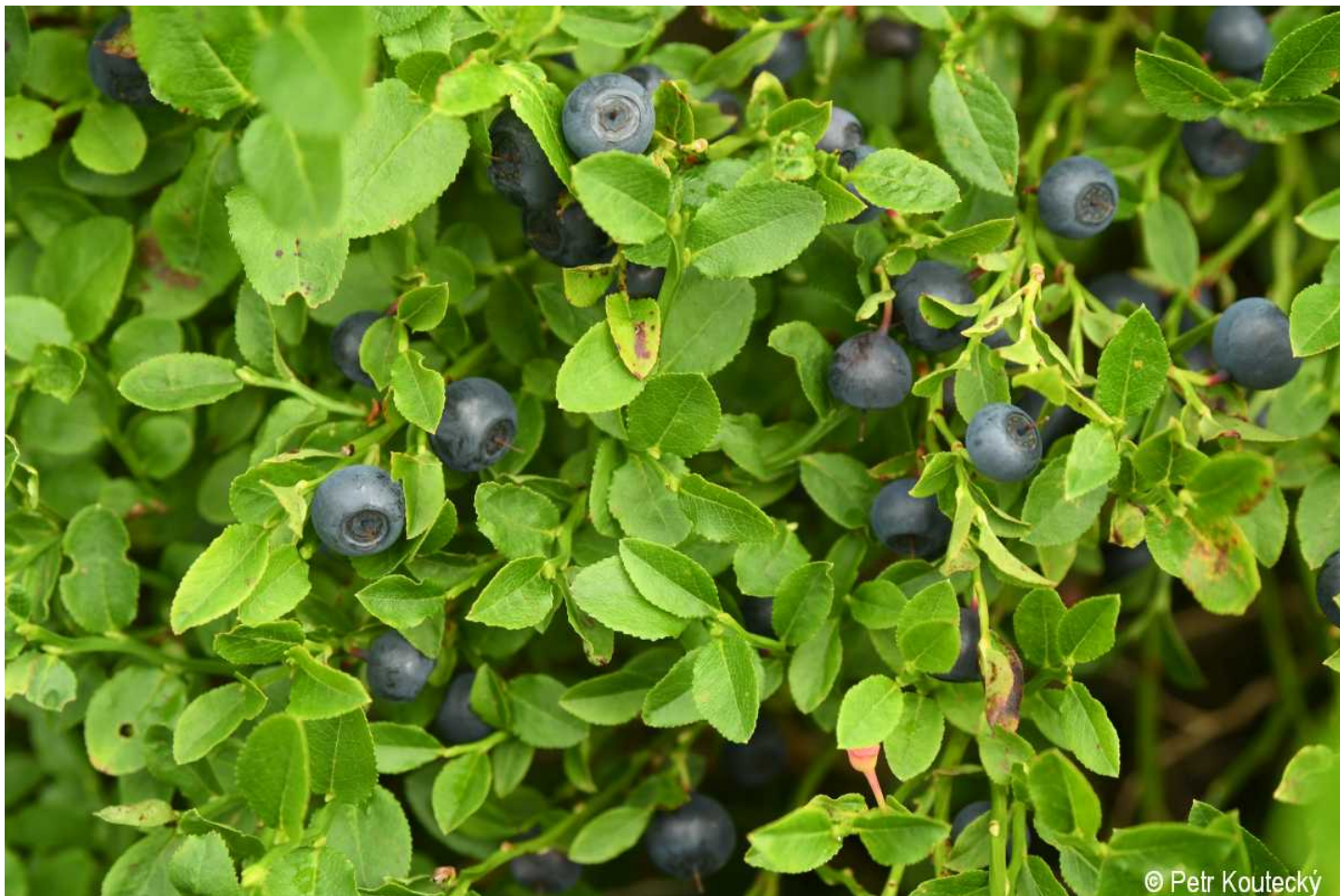
Vaccinium myrtillus – Petr Koučeký – Černá hora.