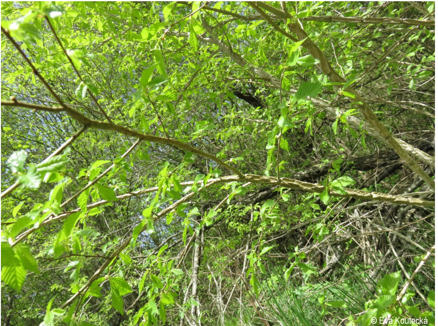
Ulmus minor – Eva Koutecká – Uhlíkov.