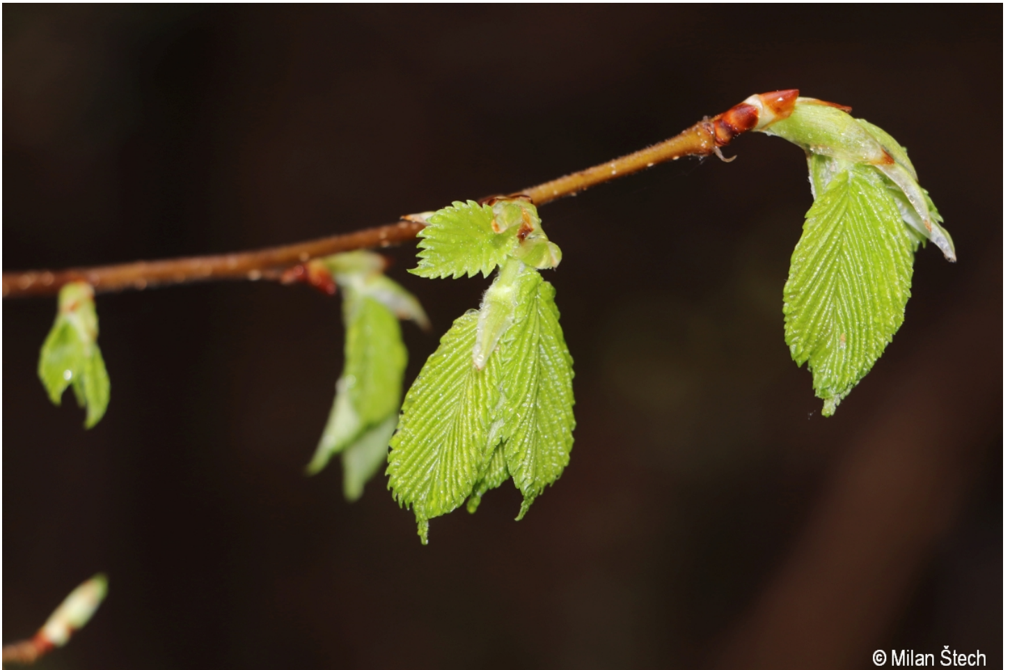
Ulmus laevis – Milan Štech – Grosser Filz.