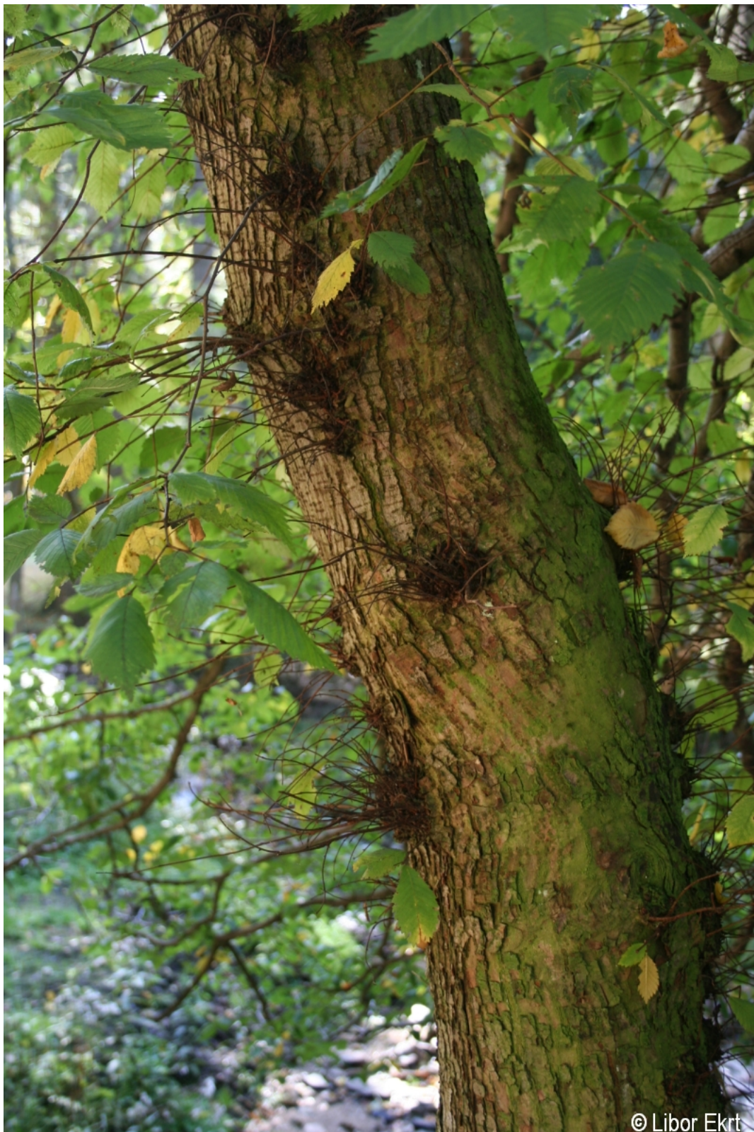
Ulmus laevis – Libor Ekrt – Pěňivý potok.