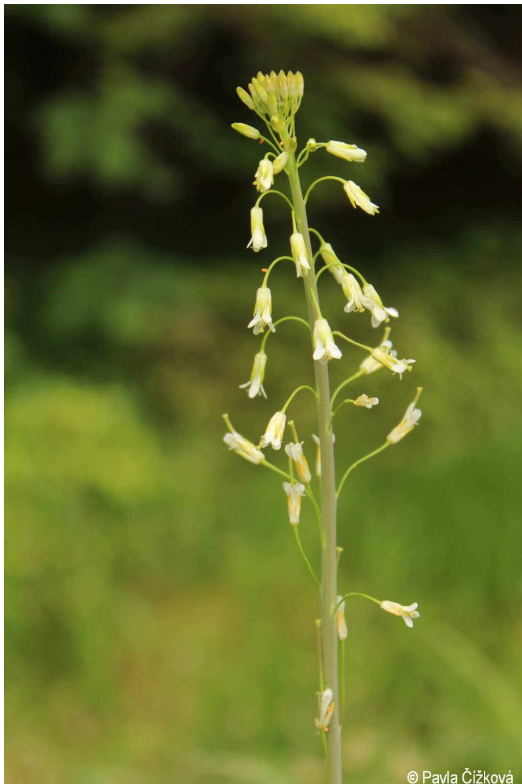
Arabis glabra – Pavla Čížková – Zátoň.