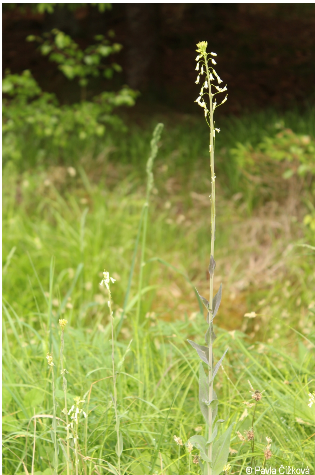
Arabis glabra – Pavla Čížková – Zátoň.