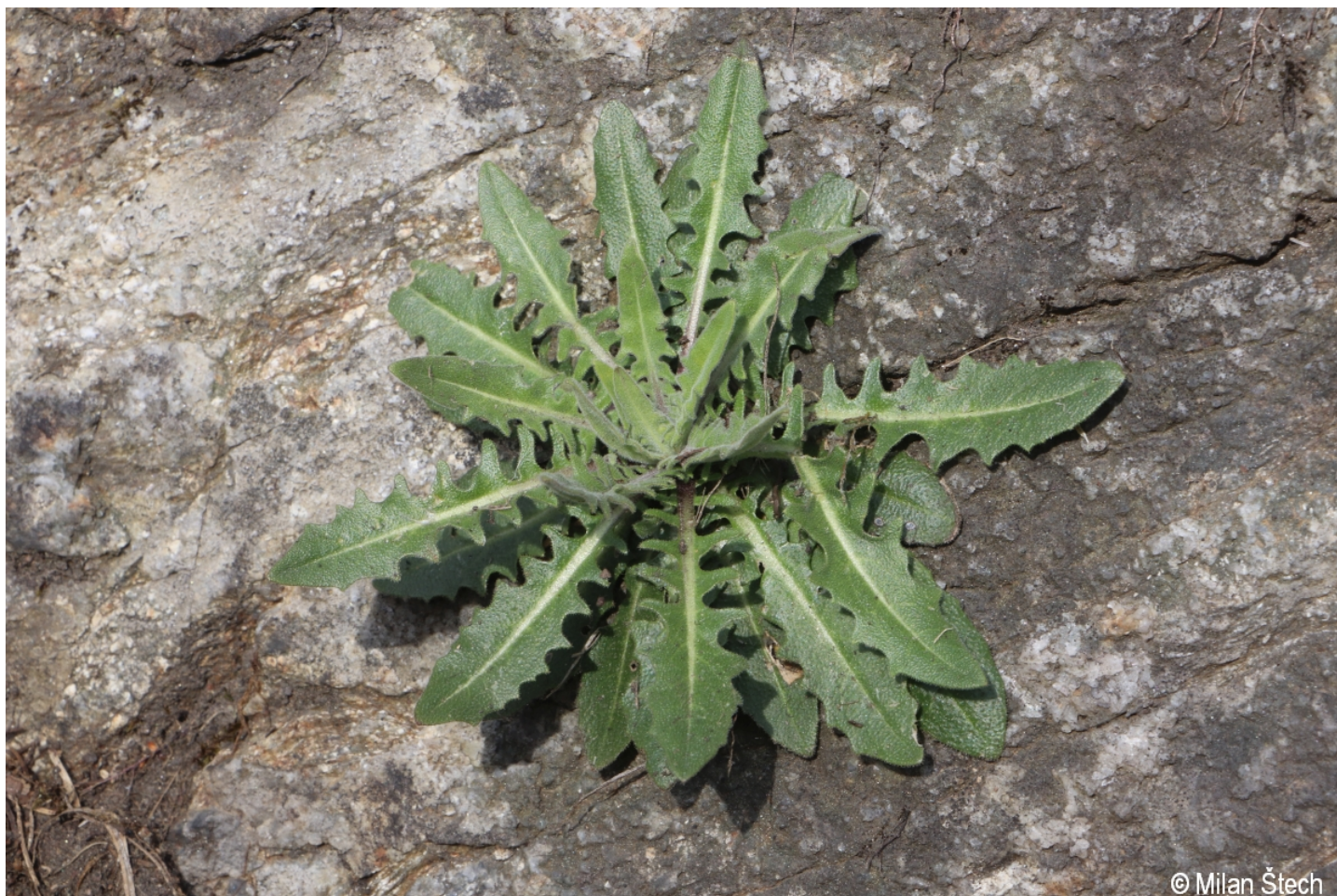
Arabis glabra – Milan Štech – Losenice.