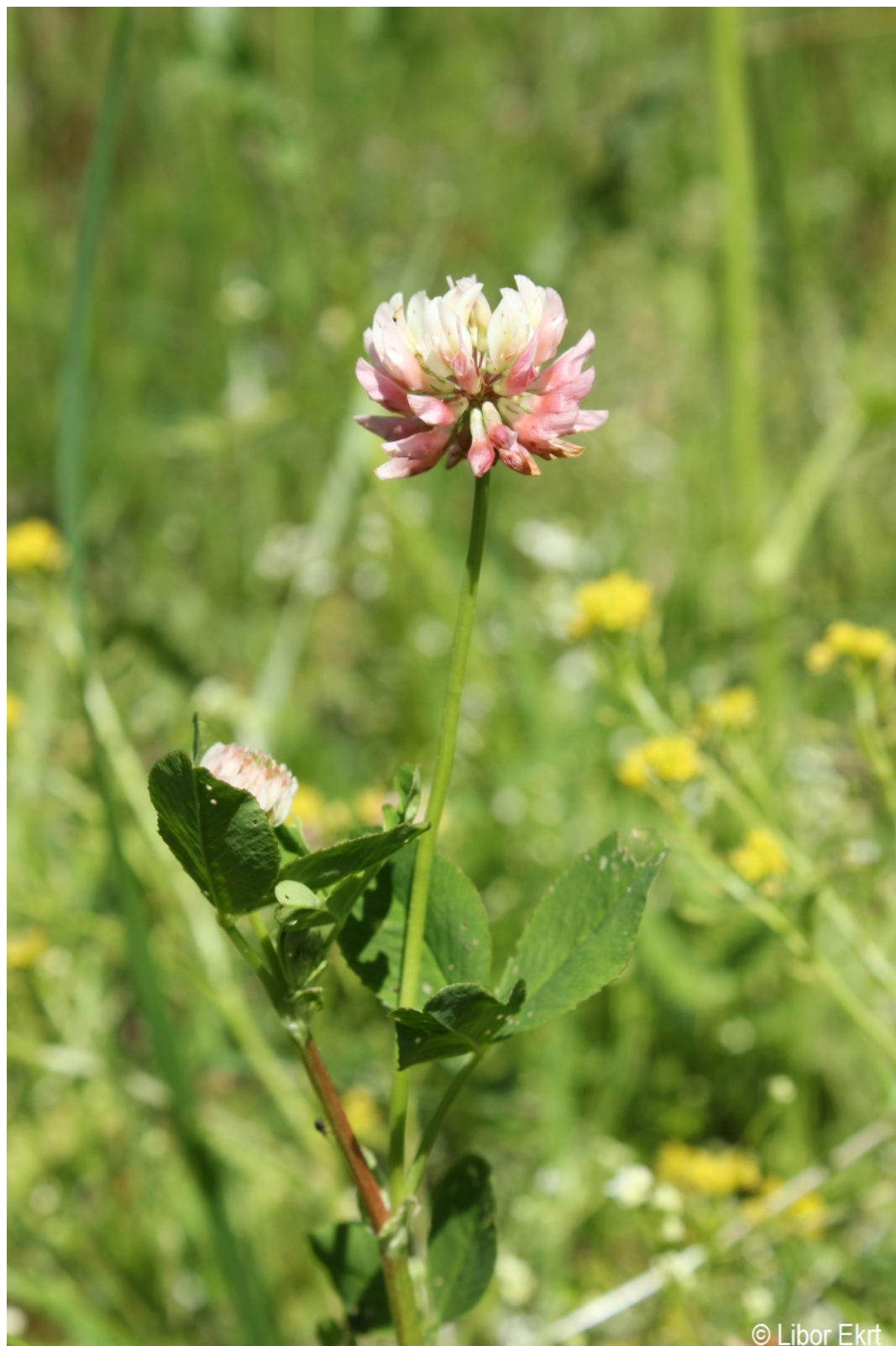
Trifolium hybridum – Libor Ekrť – Hodňov.