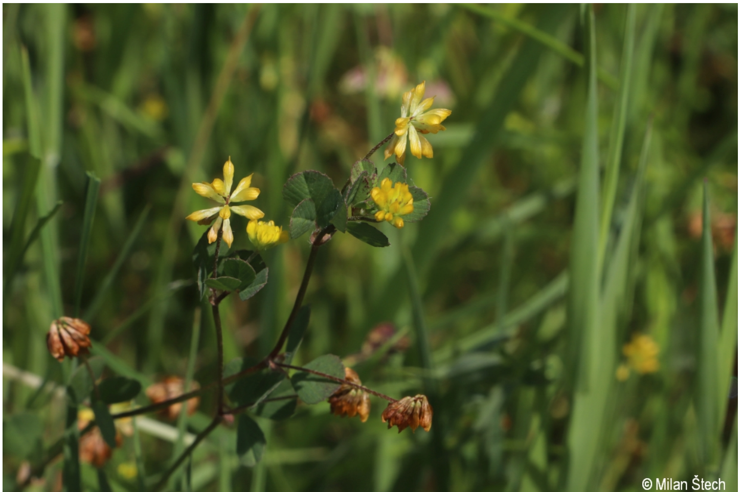
Trifolium dubium – Milan Štech – Svojše.