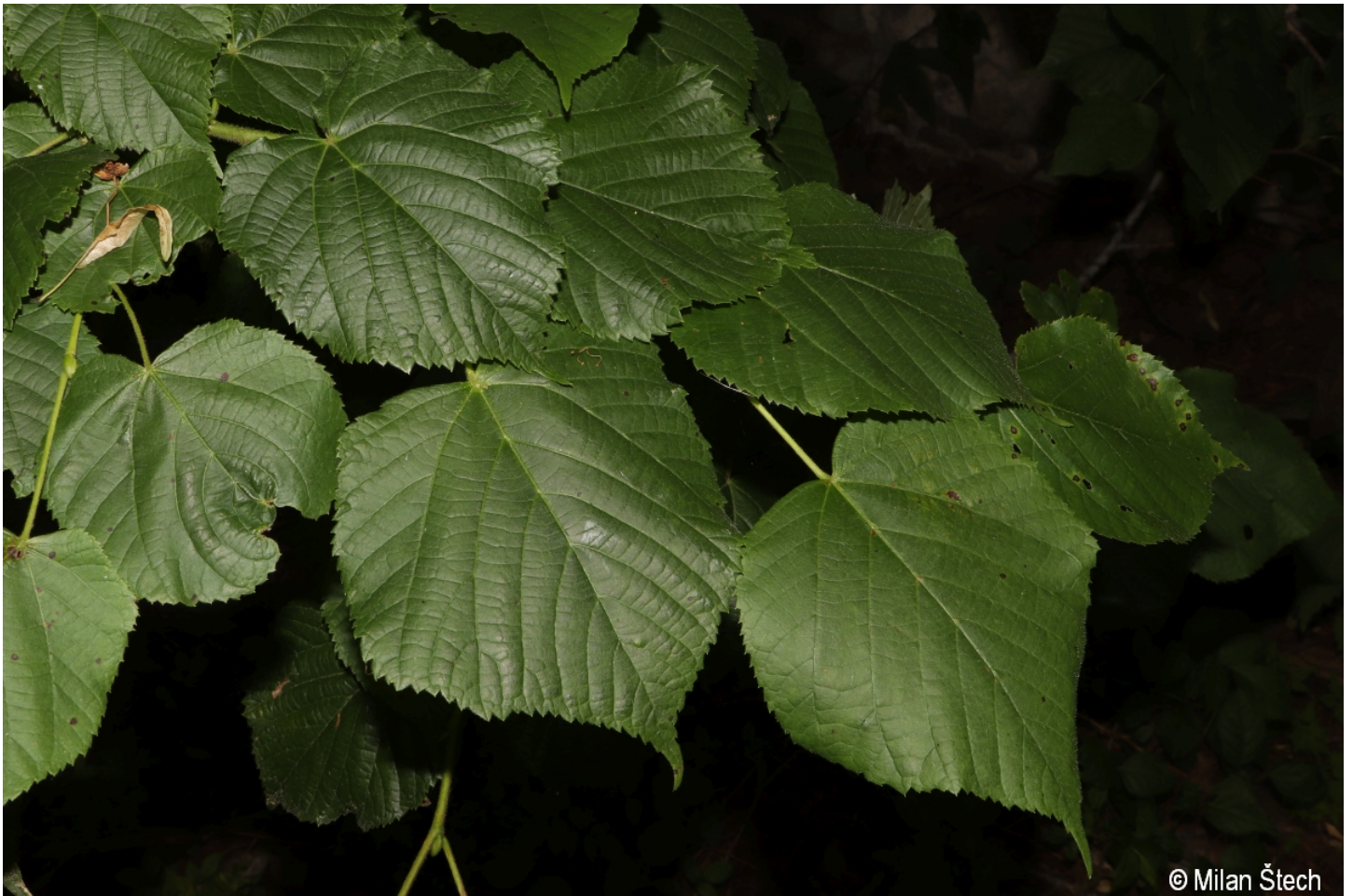
Tilia platyphyllos – Milan Štech – Želnavá.