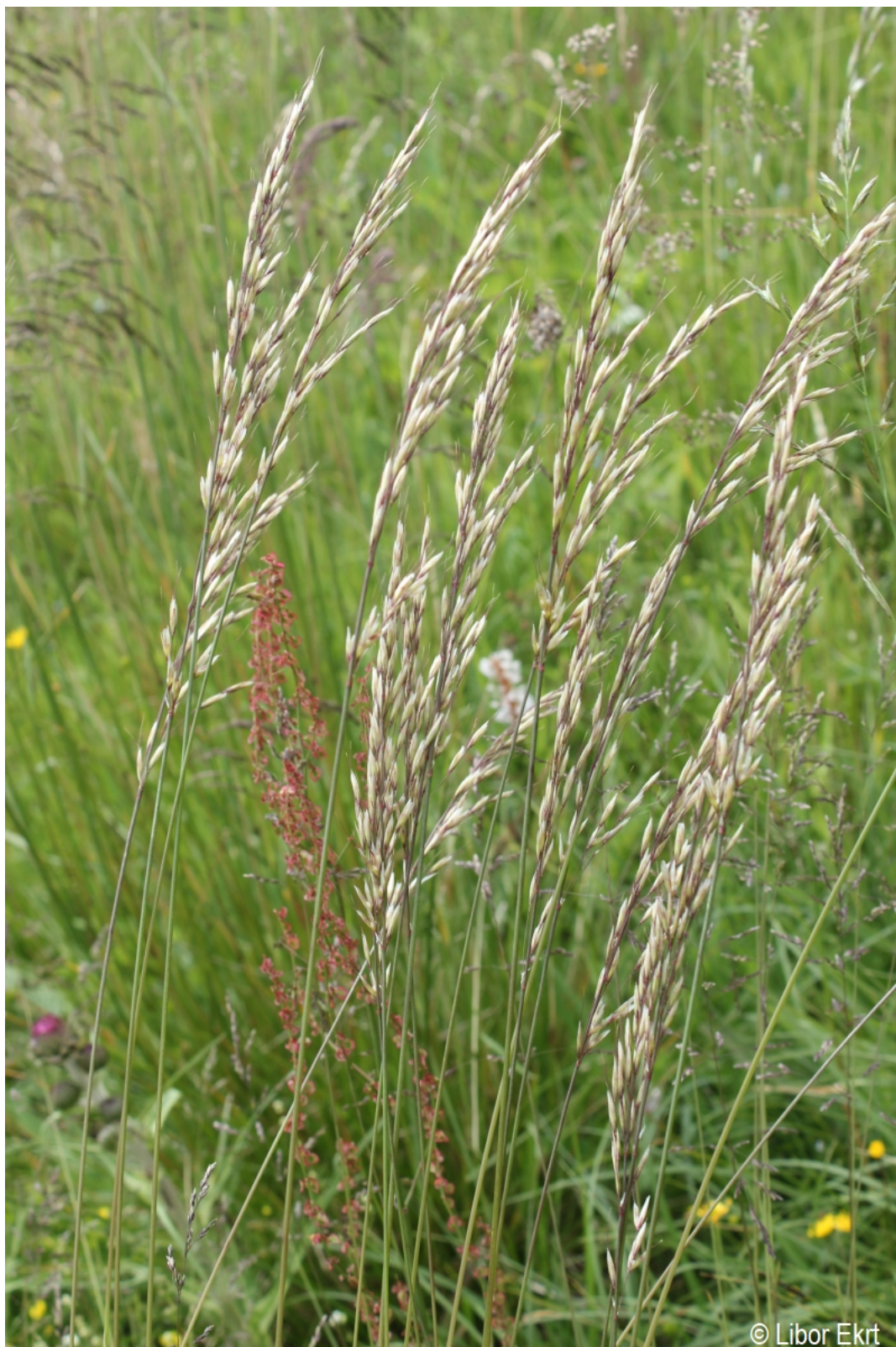
Helictotrichon pubescens – Libor Ekrť – Pestřický vrch.