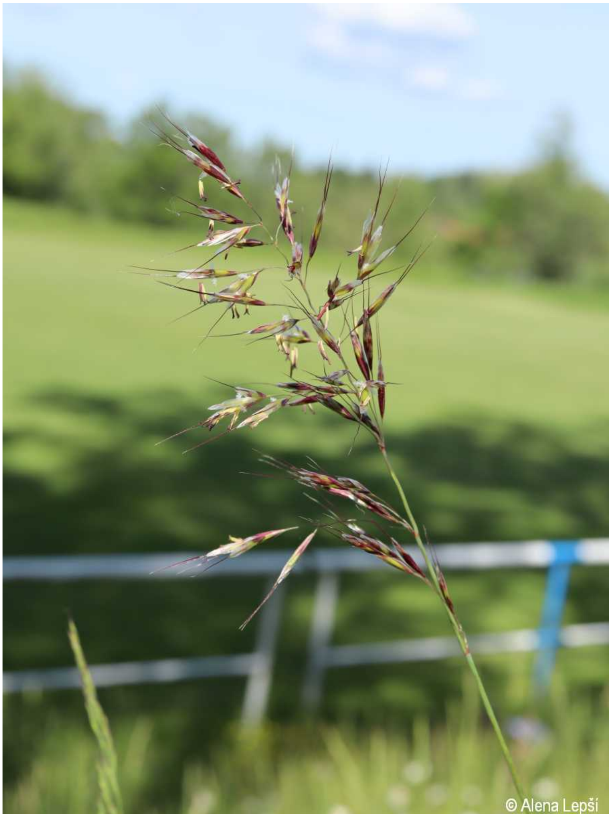
Helictotrichon pubescens – Alena Lepší – Kašperské Hory.