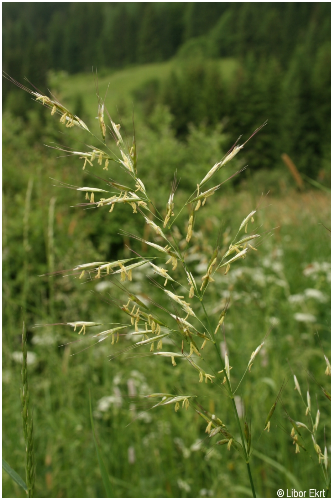
Helictotrichon pubescens – Libor Ekrť – Jelení Vrchy.