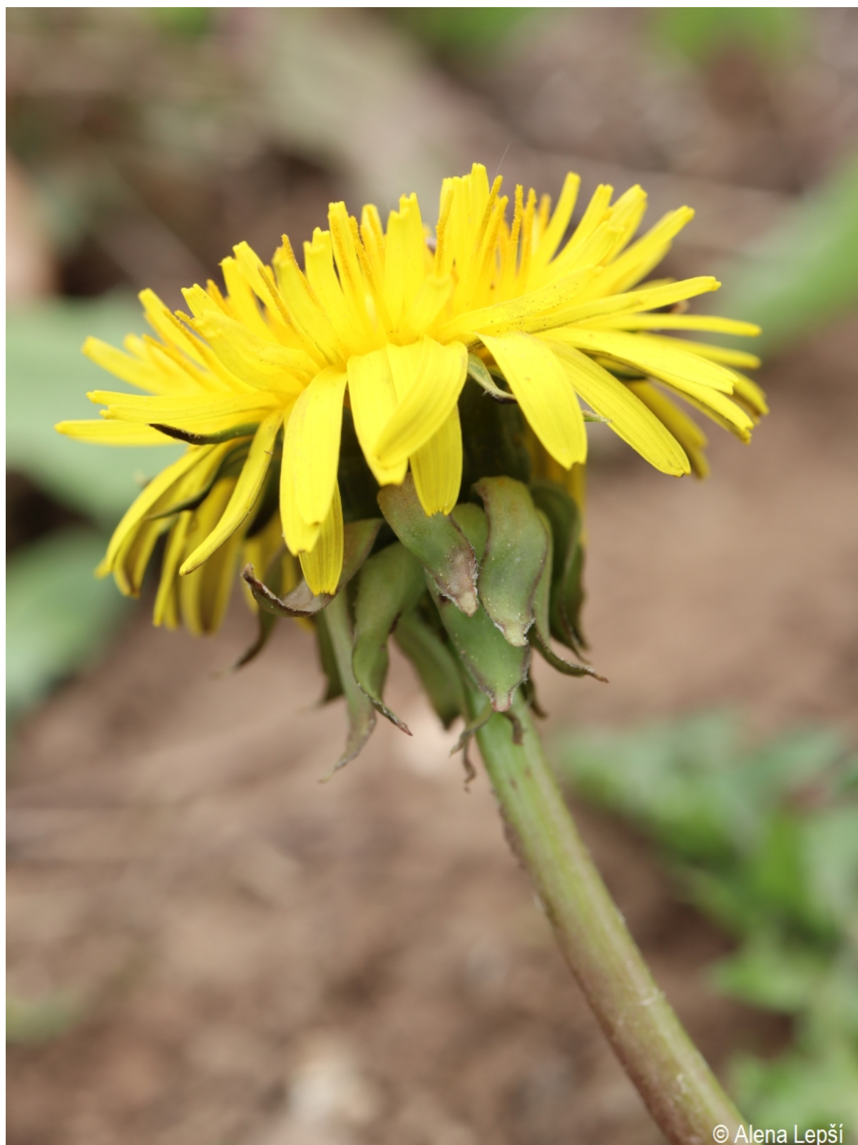
Taraxacum fasciatum – Alena Lepší – Srní, Mechov.