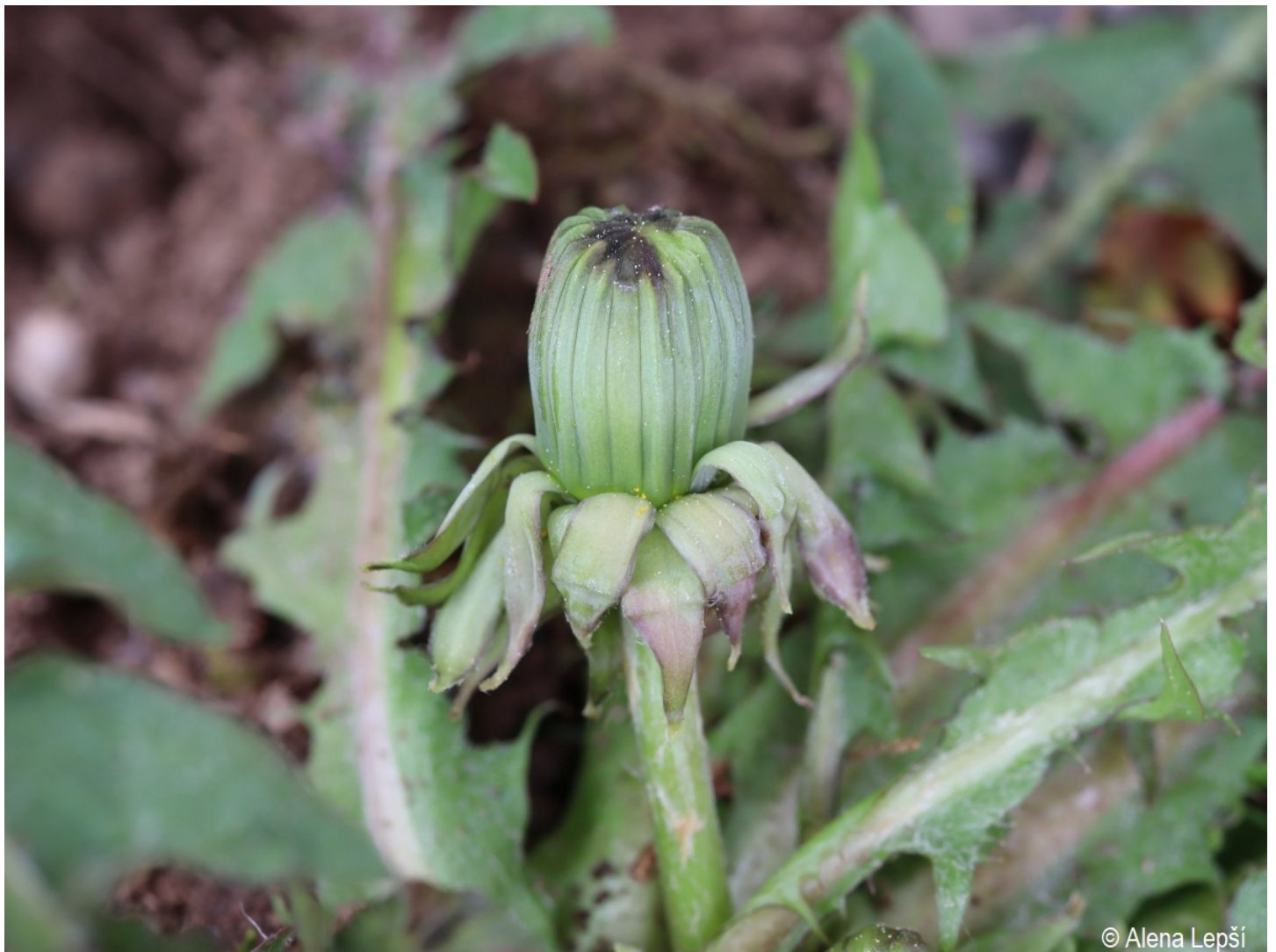
Taraxacum fasciatum – Alena Lepší – Srní, Mechov.