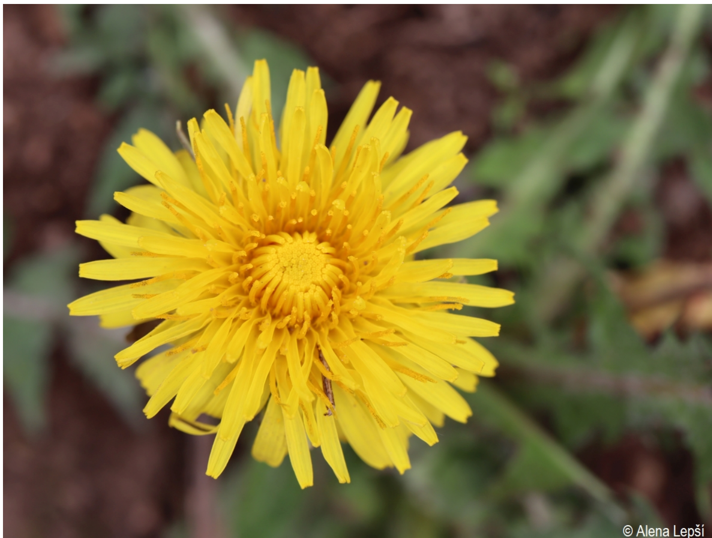
Taraxacum fasciatum – Alena Lepší – Srní, Mechov.