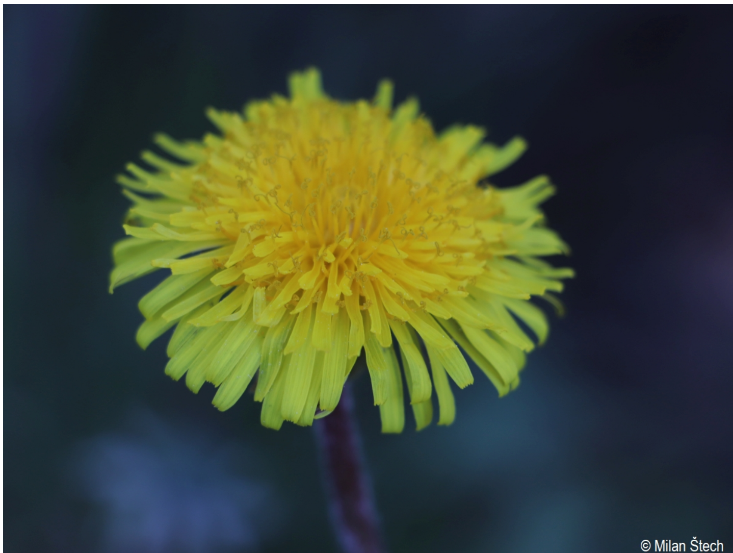
Taraxacum elegantius – Milan Štech – Březovík.