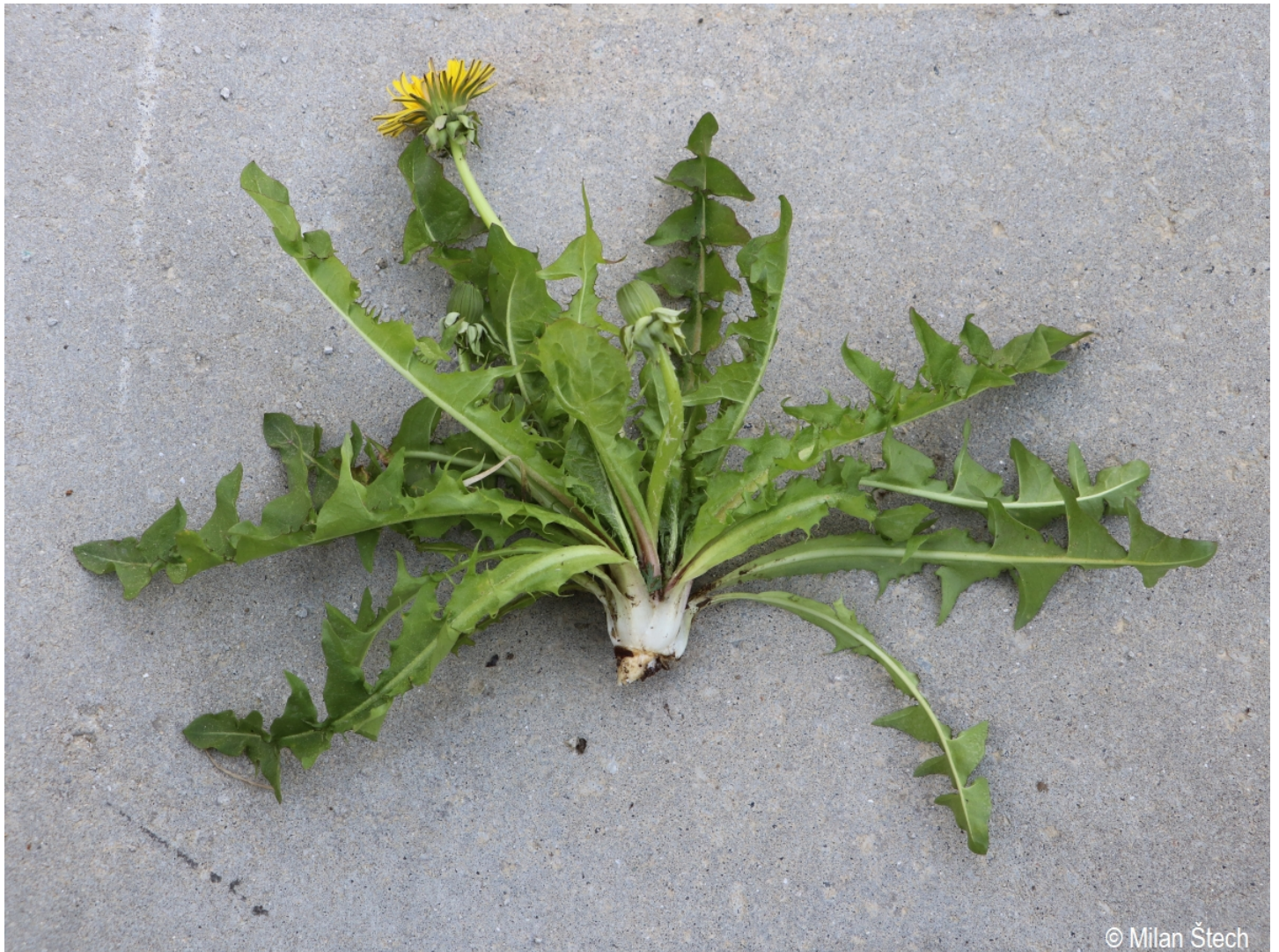
Taraxacum ekmanii – Milan Štech – Volary.