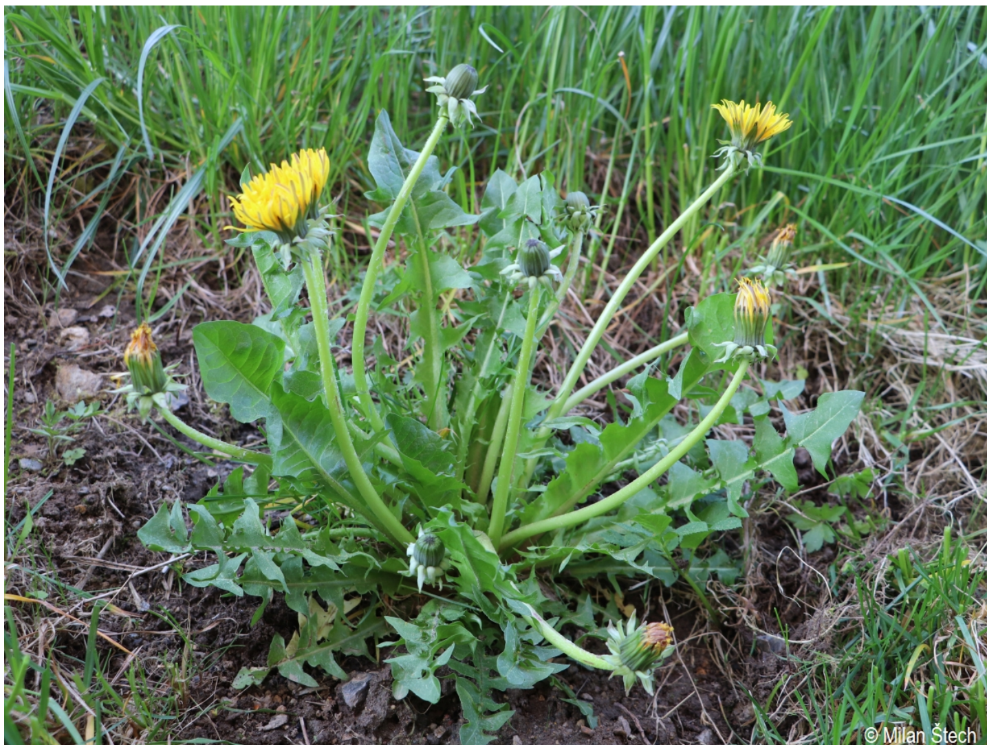
Taraxacum ekmanii – Milan Štech – Volary.