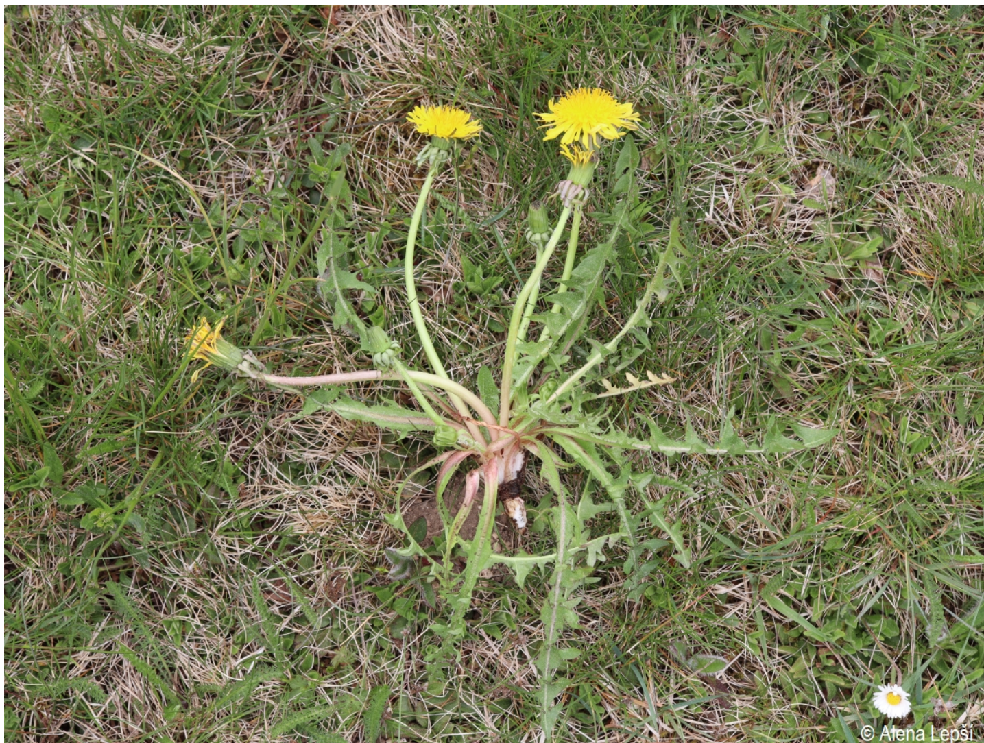
Taraxacum deltoideifrons – Alena Lepší – Srní, Mechov.