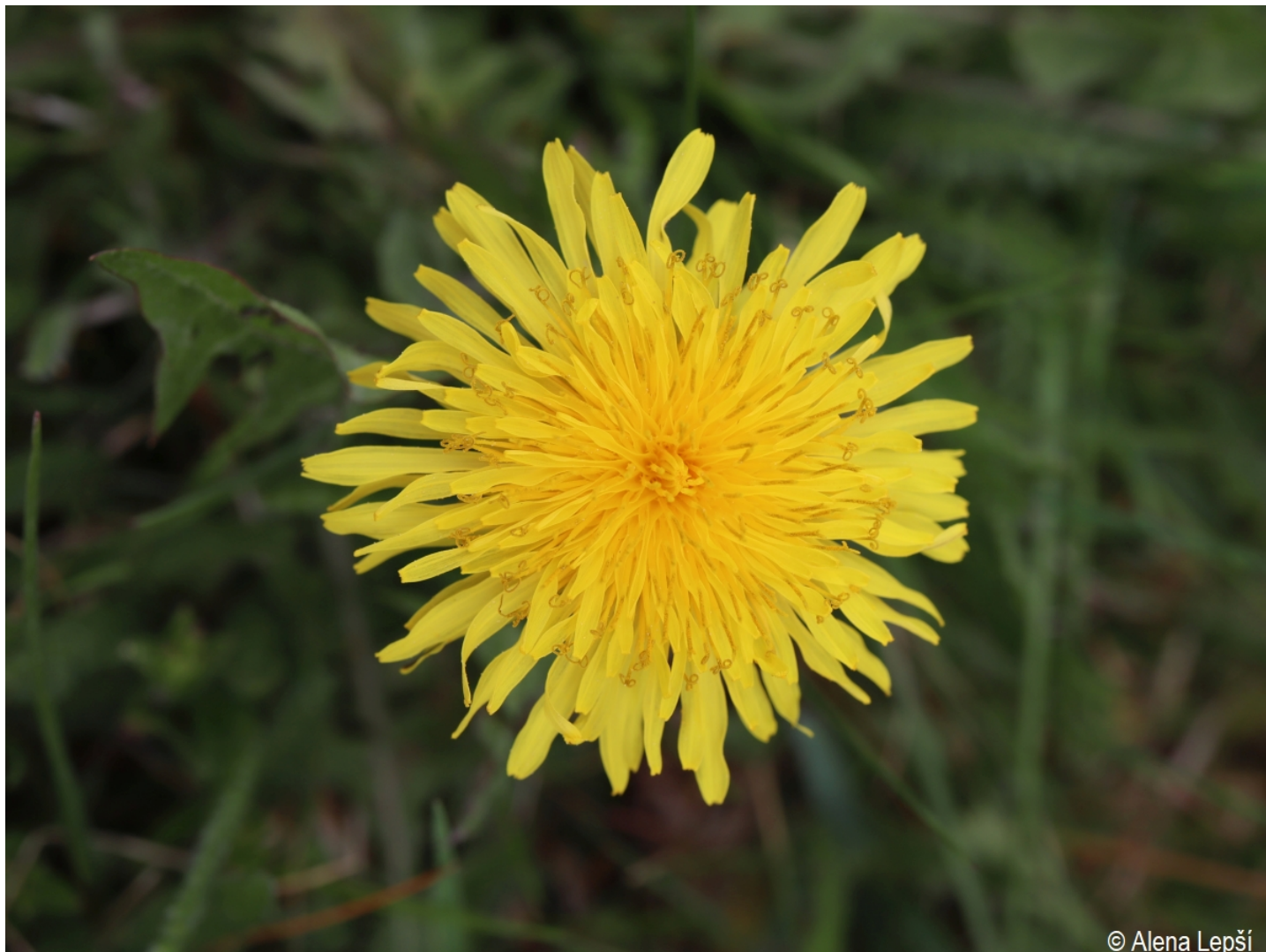
Taraxacum deltoideifrons – Alena Lepší – Srní, Mechov.