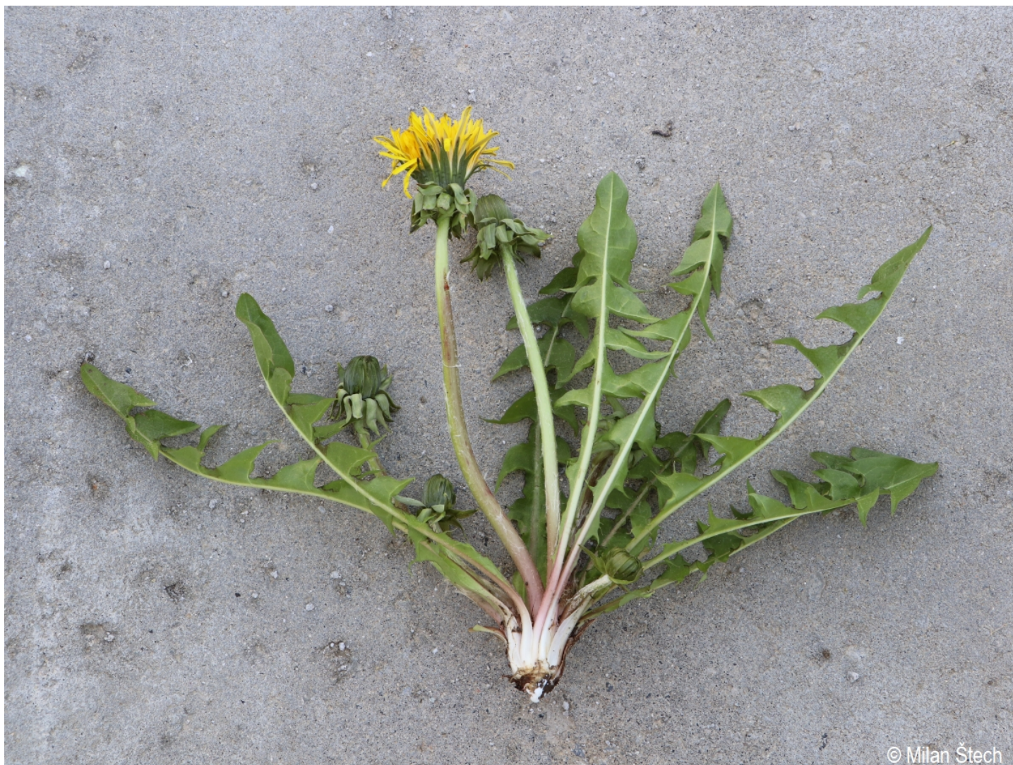
Taraxacum crassum – Milan Štech – Volary.